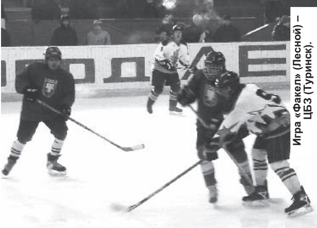
Игра «Факел» (Лесной) - ЦБЗ (Туринск).