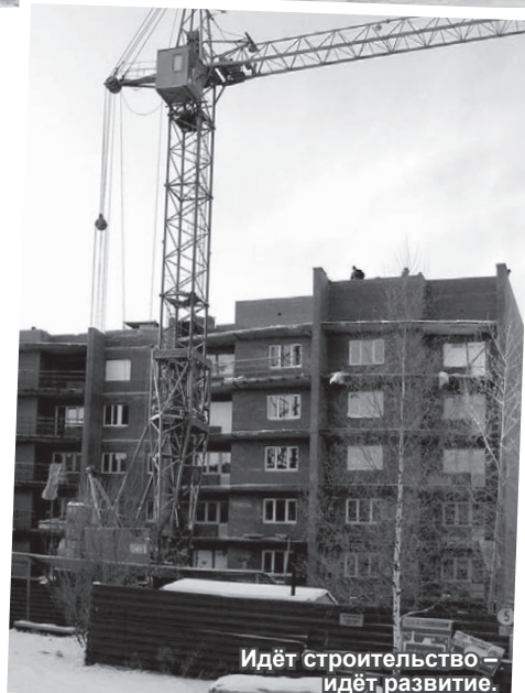
Идёт строительство – идёт развитие.

Второй вопрос. У нас очень серьезная проблема, и об этом должны люди знать, по обеспечению холодной водой. По результатам на 1 декабря 2009 года наш долг перед комбинатом «Электрорхимприбор» за холодную воду