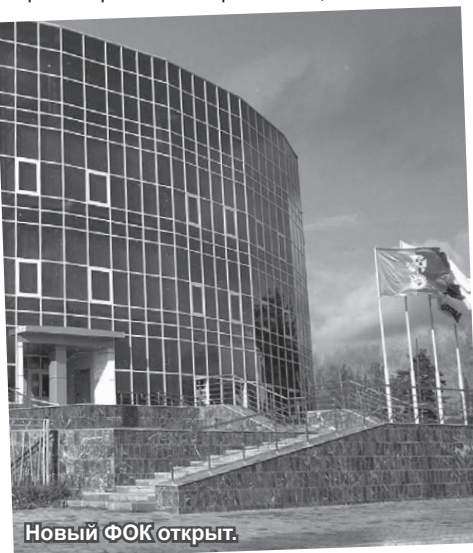
Новый ФОК открыт.