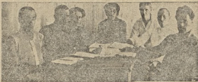
Участники совещания рабочих 25-тысячников.