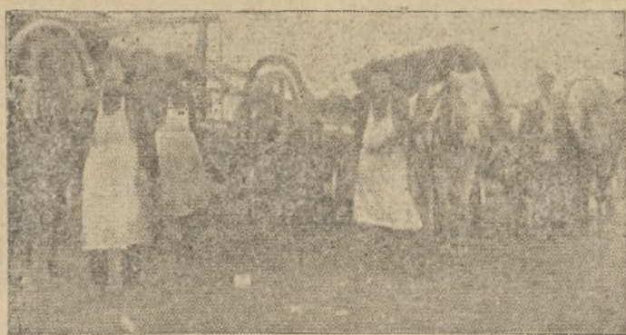
Леневские колхозники сдают хлеб.

В эту осень надо вспахать не меньше 14.000 га под зябь и вывезти весь навоз на поля, приготовить семян, чтобы в 1931 году увеличить на 15 проц. площадь посева, а остальную землю засеять травой и кормовыми культурами, для