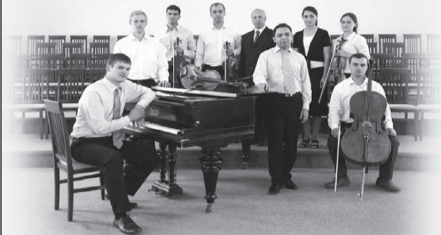
Ансамбль побывал во многих городах России, Украины и Белоруссии со свидетельством о Божьей любви и милости