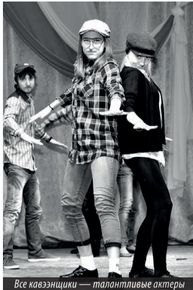
Все кавээнщики — талантливые актеры

мы в номинации «Зачет!» за участие в фестивале.