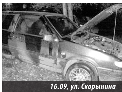
16.09, ул. Скорынина

ло сообщение о возгорании легкового автомобиля по ул. Скорынина. По приезду пожарных было обнаружено, что собственник автомашины с пожаром справился самостоятельно, потушив его подручными средствами на площади 1 кв. м. В результате пожара автомобиль пострадал незначительно. Предполагаемая причина пожара — поджог, ущерб устанавливается.