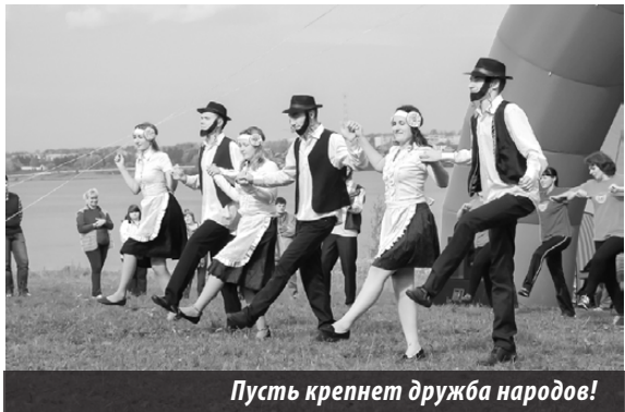
Пусть крепнет дружба народов!

зина «Апельсин». В группе Б (новички) победили «Дети мира» (команда управления образования), на 2-ом — гости из