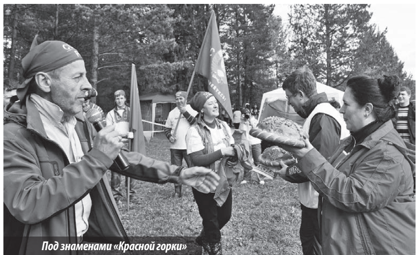
Под знаменами «Красной горки»

И не важно, кто и какие занял места, не важна победа как таковая, отдельной