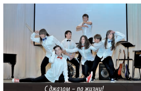
С джазом – по жизни!