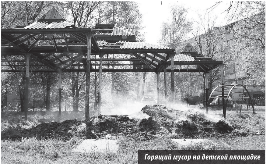
Горящий мусор на детской площадке

Женщина рассказала: «В этом детском саду творится полный бардак. Один из примеров – антисанитария. В группе моего ребенка страшно зайти в санузел, так как там уже не первый раз из унитазов всплывает и растекается их содержимое. Пахнет в такие моменты крайне жутко, а заведующая никаких мер не принимает, чтобы отремонтировать забытые трубы канализации. Жалуется ребенок и на питание. Бывает, на обед вместо второго блюда дают обычную булочку. Дети не наедаются. Кроме того, в учреждении есть два медика, однажды я обратилась к ним за медикаментами, а в ответ услышала, что их нет вообще, даже зеленки. А если, не дай бог, ребенок поранится и ему нужно будет обработать рану?.. В помещениях не первый год холодно. Освещение в группе оставляет желать лучшего: не хватает ламп для светильников. Однажды заведующая нашла оригинальное решение этой проблемы. Не посоветовавшись с родителями, она выставила помимо обязательной оплаты, каждому родителю дополнительный счет на лампы в размере 5 тыс. 600 руб. Многие из них промолчали, а я написала заявление в прокуратуру, благодаря