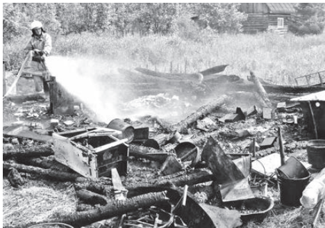
ЦПП и ОС СУ ФПС №6 МЧС России.

30 июня во втором часу дня в коллективном саду №35 (п. Горный) на территории своего садового участка женщина топила печь, предварительно сняв металлическое колесо с печной трубы. Из-за нарушения устройства отопительной печи и дымохода дом загорелся. Площадь пожара составила 6 кв. метров.