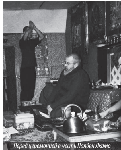
Перед церемонией в честь Палден Лхамо

копыт — символ обновляющейся жизненной энергии человека. В середине таких флажков изображается лошадь, а по углам — животные-стражи сторон света: тигр, снежный лев, дракон и мифическая птица гаруда. Пространство между ними заполняется молитвами-благопожеланиями. Вывешивая