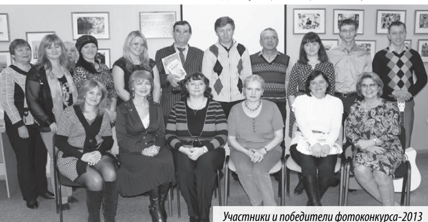
Участники и победители фотоконкурса-2013