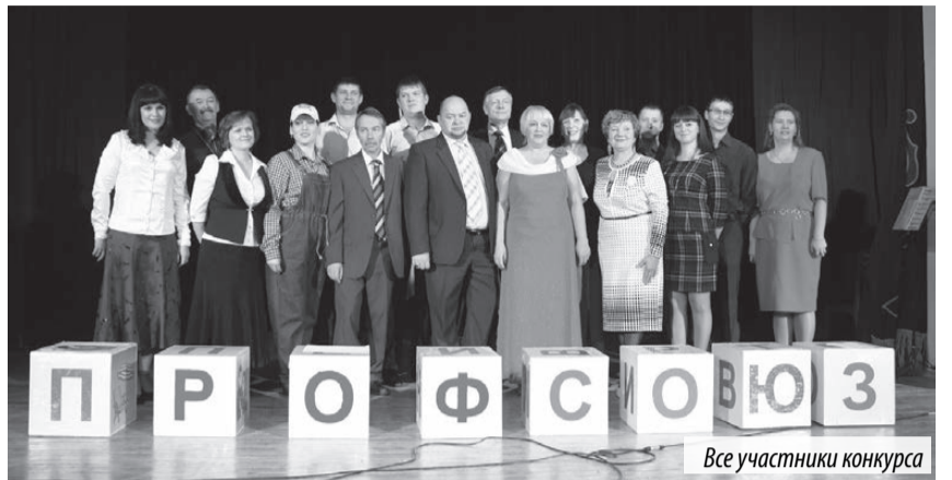
Все участники конкурса