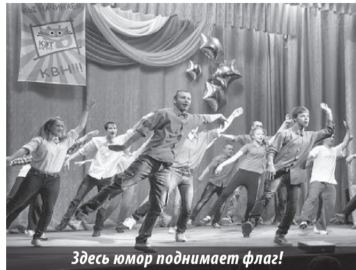
Здесь юмор поднимает флаг!

22 ноября в актовом зале ИГРТ поздравляли кэтовцев