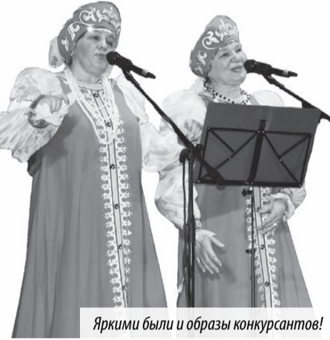
Яркими были и образы конкурсантов!

Все конкурсанты волновались в тот вечер: и дебютанты, и уже опытные само-