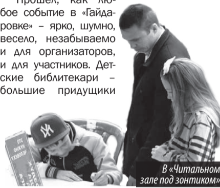
В Читальном зале под зонтиком

Прошел, как любое событие в «Гайдаровке» – ярко, шумно, весело, забываемо и для организаторов, и для участников. Детские библиотекарки – большие придумщицы