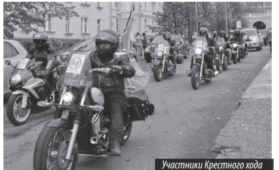
Участники Крестного хода