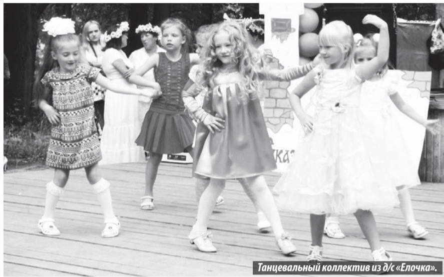
Танцевальный коллектив из д/с «Елочка».

13 июля состоялось празднование 189-летия Иса