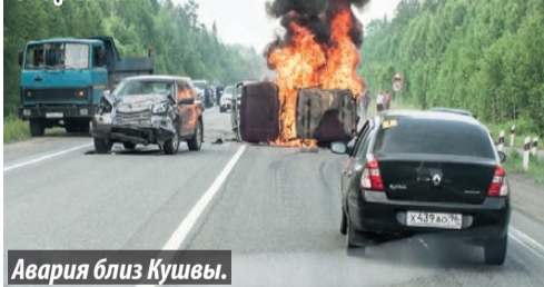
Авария близ Кушвы.

На трассе Серов – Екатеринбург сгорел автомобиль