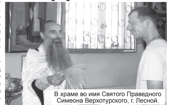
В храме во имя Святого Праведного Симеона Верхотурского, г. Лесной.

И была потом общая благодатная молитва за здоровье, и вкусный чай в трапезной, но, прежде чем приступить к чаепитию