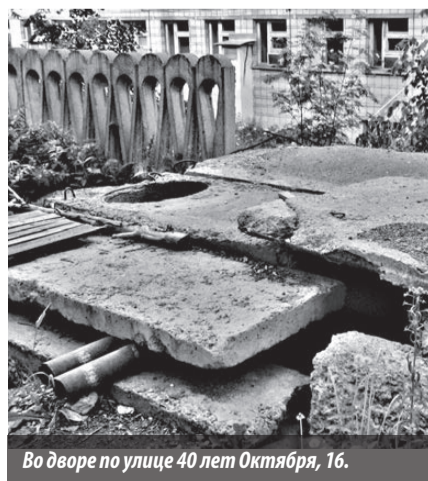
Во дворе по улице 40 лет Октября, 16.

Страсти вокруг территории кипят, начиная с 2011 года. Из февральского номера газеты «Время» за тот год местные жители узнали: чиновники решают, что построить в этом дворе: баню или детсад. От последнего решили отказаться, так как место было признано неудобным для дошкольного учреждения. Не удалось реализовать и «банный» проект – горожане выступили против.