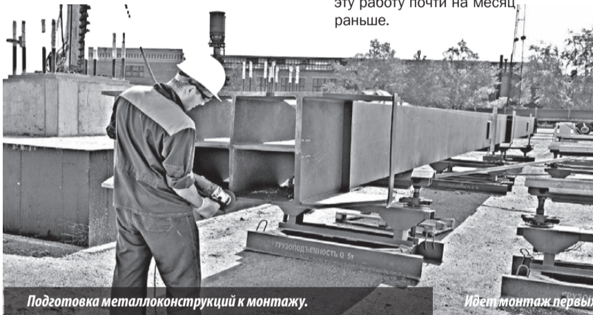
Подготовка металлоконструкций к монтажу.