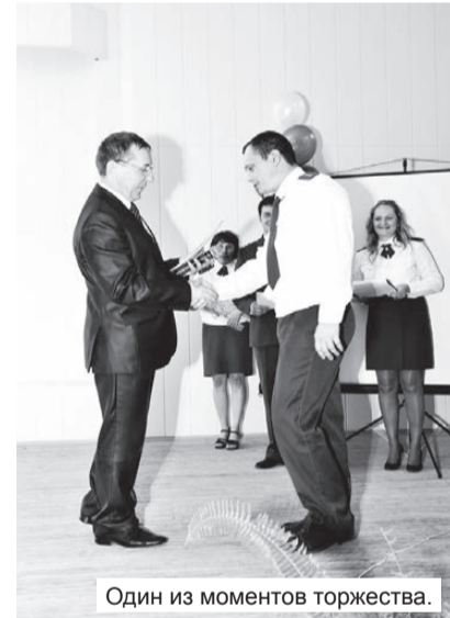
Один из моментов торжества.

Нижнетуринский РОВД отметил свое 60-летие