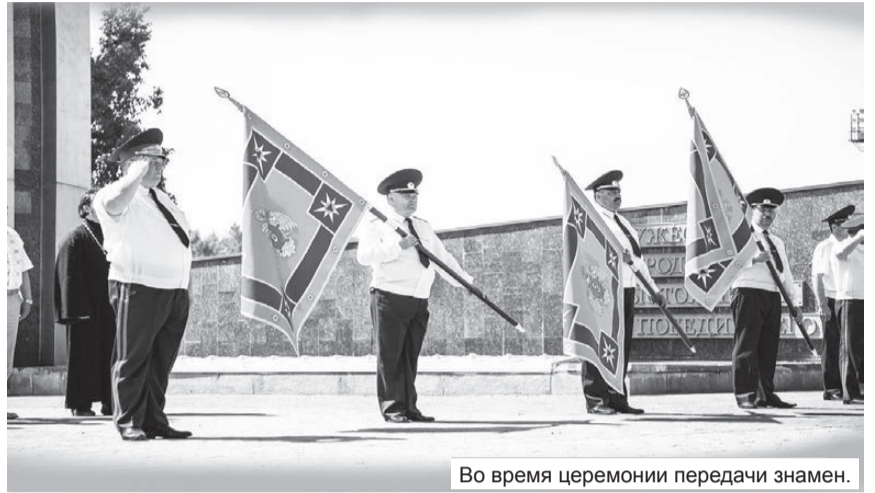
Во время церемонии передачи знамен.

МЧС Лесного получило собственное боевое знамя