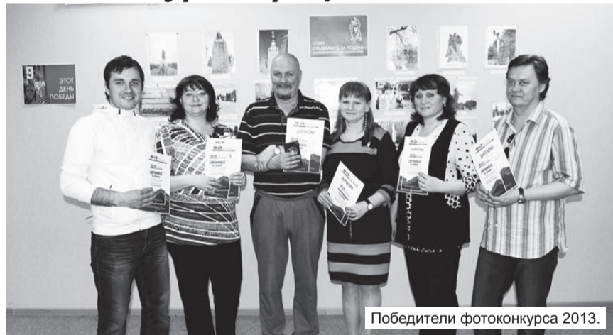
Победители фотоконкурса 2013.