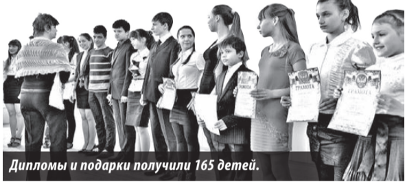
Дипломы и подарки получили 165 детей.

Никогда бы не подумал, что в нашем небольшом городке столько талантливой и одаренной молодежи! Поздравляем вас, ребята и девчата, с вашими успехами! Вы заслужили этот праздник, эти награды и этот почет! Молодцы!!!