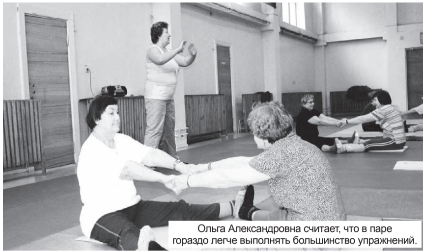
Ольга Александровна считает, что в паре гораздо легче выполнять большинство упражнений.

О группе здоровья неработающих пенсионеров комбината «ЭХП» и города