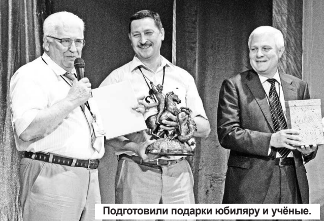
Подготовили подарки юбиляру и учёные.