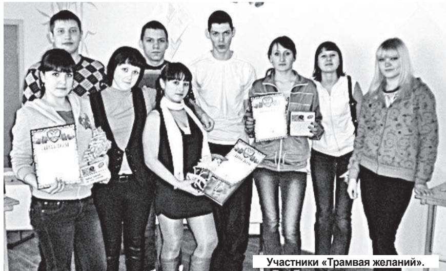
Участники «Трамвая желаний».