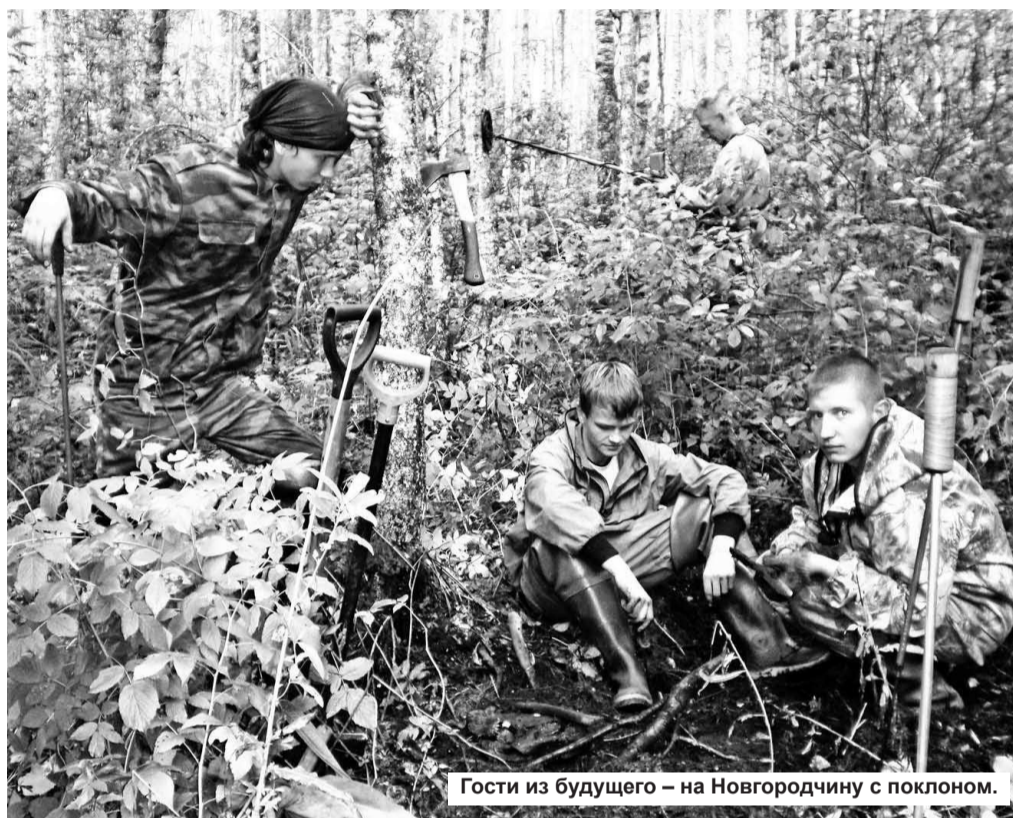
Гости из будущего – на Новгородчину с поклоном.