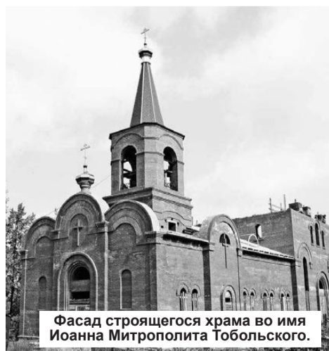
Фасад строящегося храма во имя Иоанна Митрополита Тобольского.

В последнее время в местных изданиях можно было прочитать информацию о том, что строительные работы Нижнетуринского храма приостановлены в связи с отсутствием подрядчика для проведе-