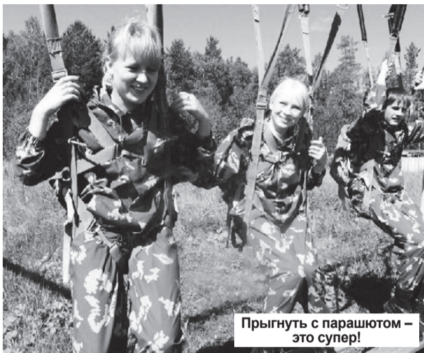
Прыгнуть с парашютом — это супер!

В течение минувшего учебного года ребята из военно-патриотического клуба «Алмаз» Исовского геологоразведочного техникума активно участвовали в городских и областных культурных, спортивных мероприятиях, прошедших на базе нашего техникума. Лето-2011 выдалось для клуба таким же горячим.