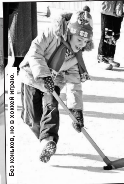
Без коньков, но в хоккее играю.