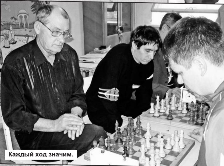
Каждый ход значим.