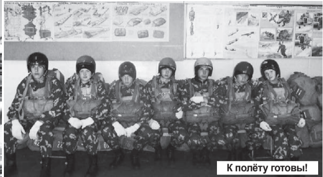
К полёту готовы!

программе. В короткий срок ребятам предстояло изучить основы прыжков и управления парашютом. Большое внимание инструкторы уделили чрезвычайным ситуациям, с которыми связан парашютный спорт.