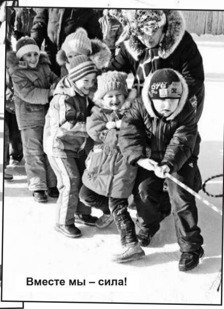
Вместе мы – сила!