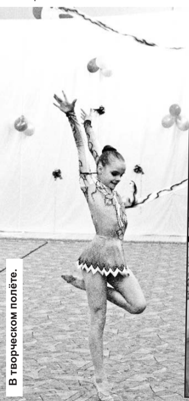
В творческом полёте.