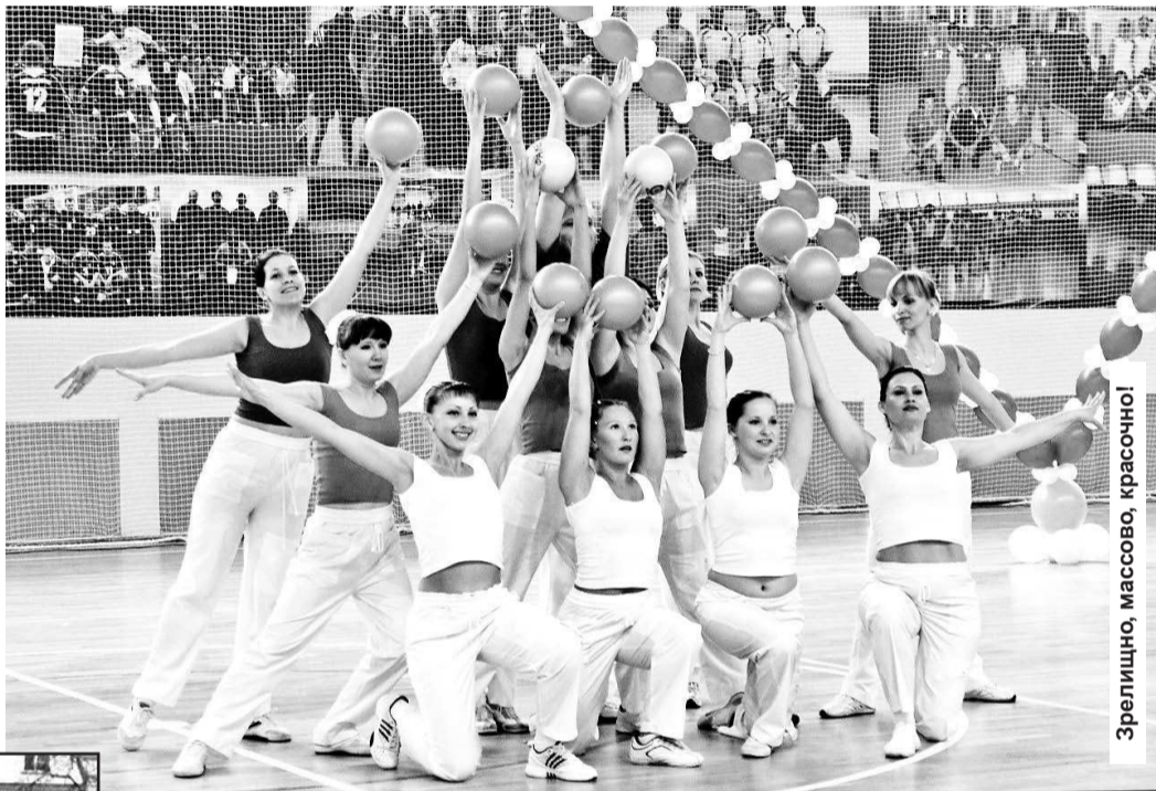
Зрелищно, массово, красочно!