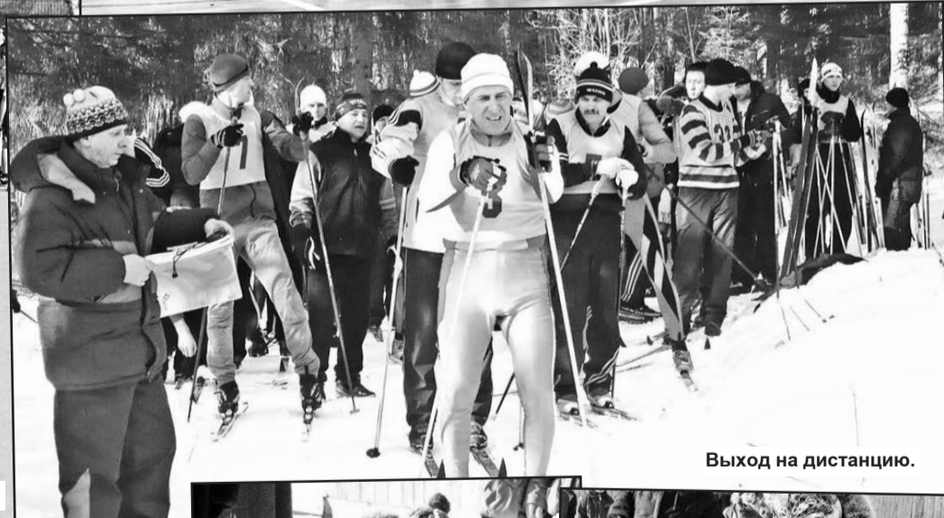
Выход на дистанцию.