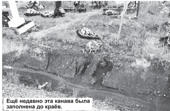
Ещё недавно эта канава была заполнена до краёв.