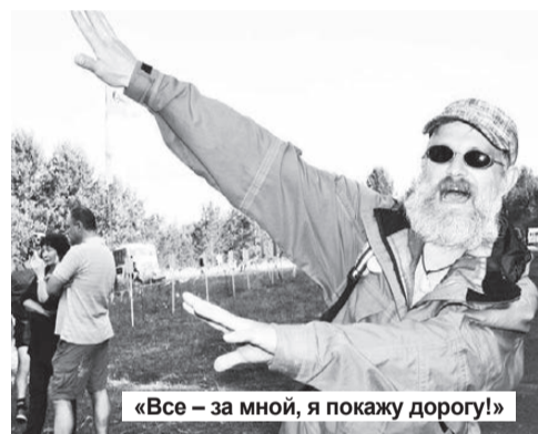
«Все – за мной, я покажу дорогу!»