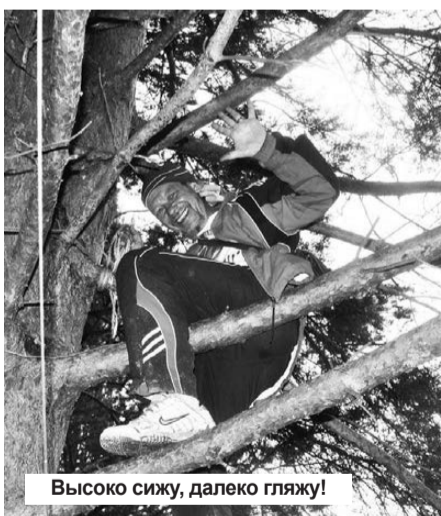
Высоко сажу, далеко гляжу!