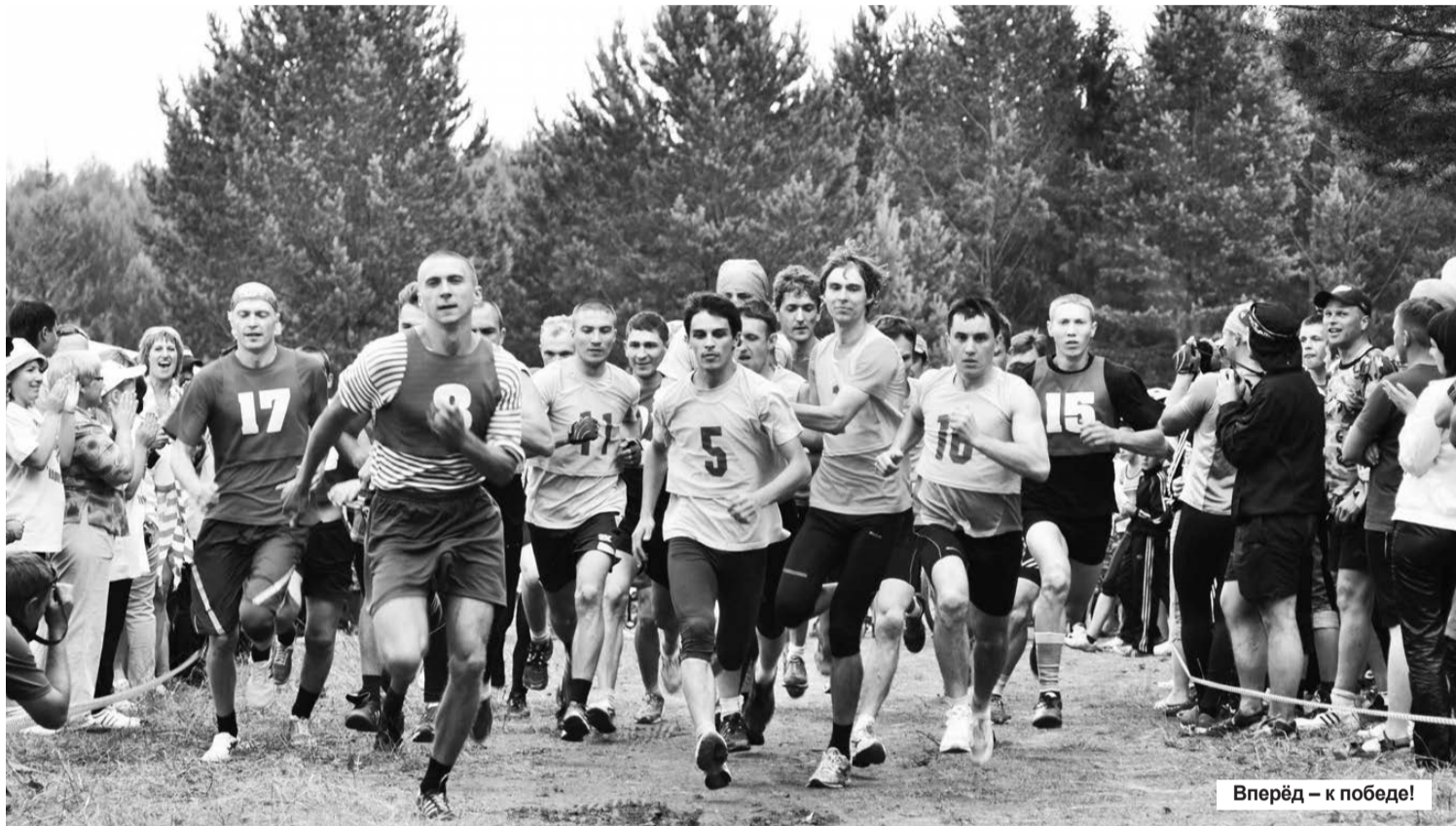
Вперёд – к победе!