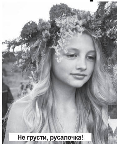
Не грусти, русалочка!