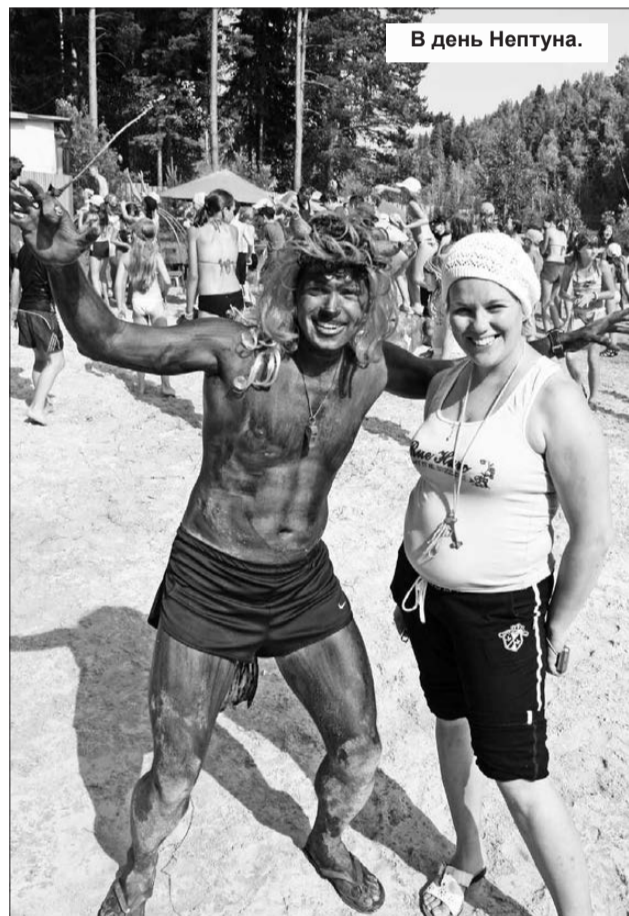
В день Нептуна.