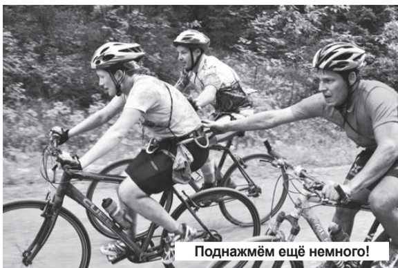
Поднажмём ещё немного!

На все объекты документы готовы. Составление договоров купли-продажи, мены, дарения. Адрес: г. Н. Тура, ул. Машиностроителей, 5а. Телефоны: 8-922-163-2855, 8-953-057-4770