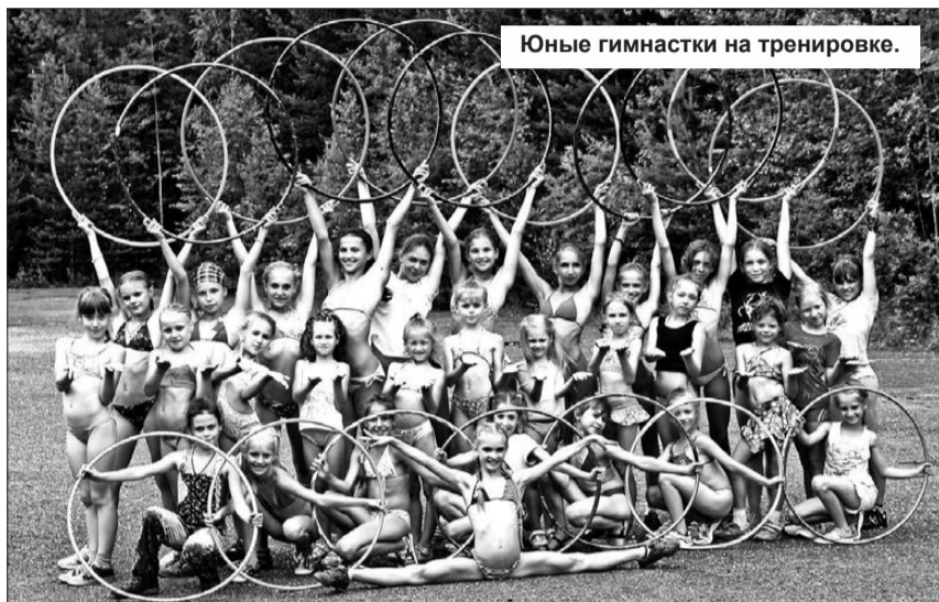
Юные гимнастки на тренировке.

Во вторник закончилась вторая смена в детском оздоровительном лагере «Ельничный». И, как всегда, дети не хотели покидать его. Они надолго запомнят своих воспитателей, вожатых и эти счастливые летние деньки. В прошедшую смену в лагере отдохнули 192 ребенка, в том числе отряд девочек-гимнасток, которые были частью дружного коллектива, принимали активное участие в мероприятиях, но не забывали и тренироваться.