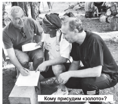
Кому присудим «золото»?