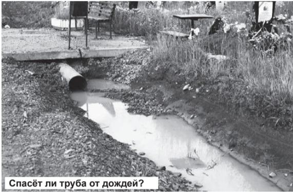
Спасёт ли труба от дождей?