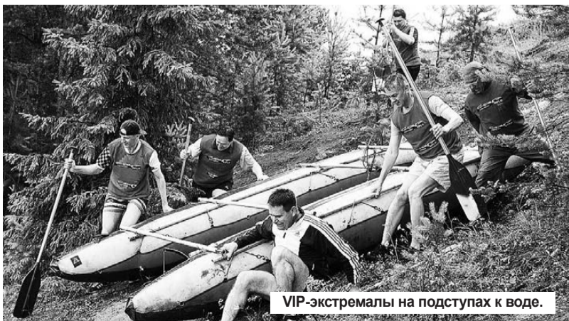
VIP-экстремалы на подступах к воде.