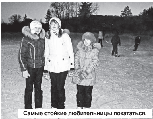
Самые стойкие любительницы покататься.