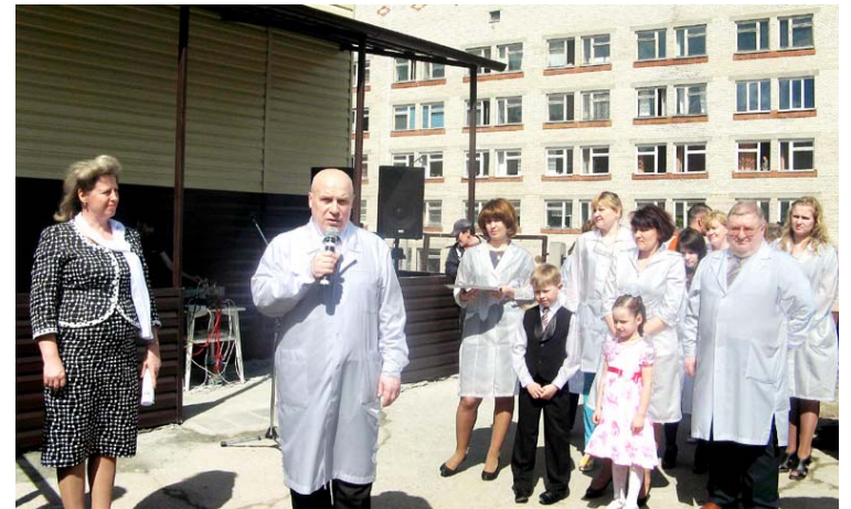
Со дня торжественного открытия после ремонта детской поликлиники прошло чуть больше трех месяцев.