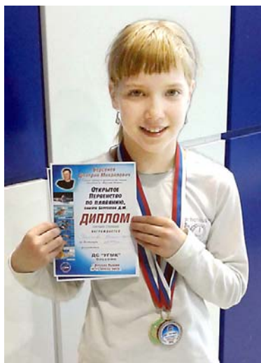
В минувшие выходные спортсмены секции плавания заводского спорткомплекса принимали участие в девятом открытом первенстве памяти Д.Берсенева в Верхней Пышме.