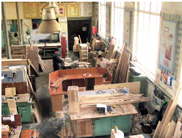
В столярной мастерской ремонтно-строительного управления.

На минувшей неделе на участке проводилось очередное обучение по пожарной безопасности. На случай форс-мажорных обстоятельств каждый должен четко выполнять свои задачи, знать, где расположены рубильники, чем тушить электрооборудование. На УЛиТе мы оформили специальный стенд, где пошаго-