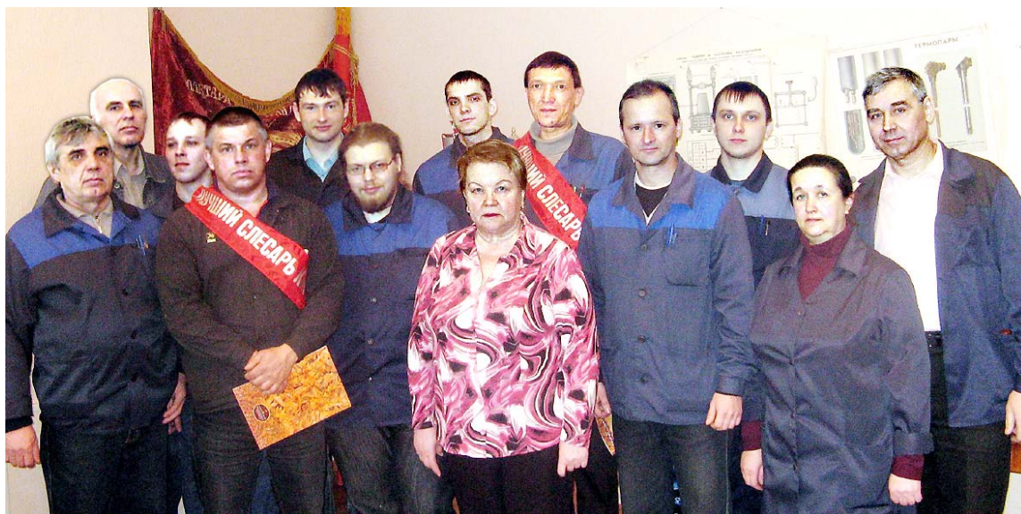
Участники мартовского конкурса профмастерства.