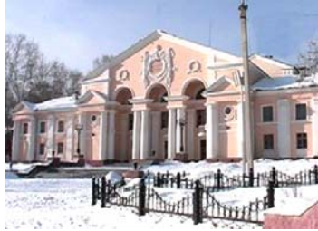
Избирательный участок № 2377

Муниципальное бюджетное общеобразовательное учреждение «Средняя общеобразовательная школа № 15», г.Первоуральск, улица 50 лет СССР, 11-а. Телефон 63-53-30.