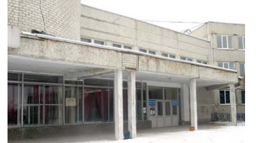
Избирательные участки № 2380 и 2381

Муниципальное бюджетное общеобразовательное учреждение «Средняя общеобразовательная школа № 15», г.Первоуральск, улица Пушкина, 1-а. Телефон 63-71-86.