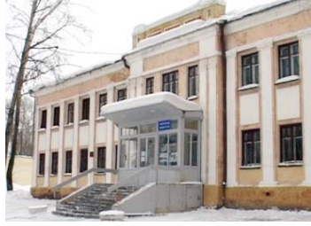
Избирательный участок № 2378

Дворец культуры «Огнеупорщик», г.Первоуральск, улица Ильича, 13. Телефон 27-83-87.