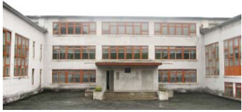
Избирательный участок № 2376

Муниципальное бюджетное общеобразовательное учреждение «Средняя общеобразовательная школа № 15», г.Первоуральск, улица 50 лет СССР, 11-а. Телефон 63-53-30.