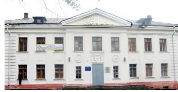
Избирательный участок № 2379

Управление соцразвития ОАО «ДИНУР», Первоуральск, улица Ильича, 7. Телефон 27-86-83.