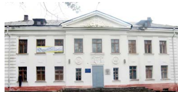
Избирательный участок № 2379

Дом техники ОАО «ДИНУР», г.Первоуральск, улица Ильича, 7. Телефон 27-86-83 .