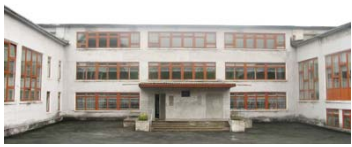
Избирательный участок № 2376

Муниципальное бюджетное общеобразовательное учреждение «Средняя общеобразовательная школа № 35», г.Первоуральск, улица 50 лет СССР, 11-а. Телефон 63-53-30 .