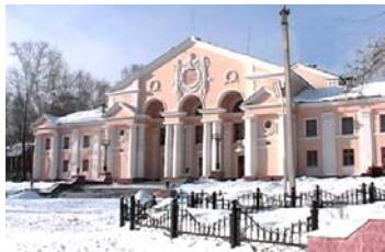
Избирательный участок № 2377

Муниципальное бюджетное общеобразовательное учреждение «Средняя общеобразовательная школа № 35», г.Первоуральск, улица 50 лет СССР, 11-а. Телефон 63-53-30 .