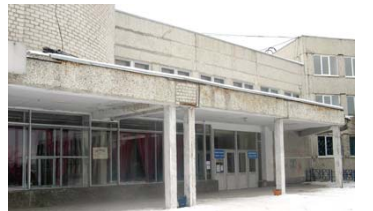
Избирательный участок № 2381

Муниципальное бюджетное общеобразовательное учреждение «Средняя общеобразовательная школа № 15», г.Первоуральск, улица Пушкина, 11-а. Телефон 63-71-86 .