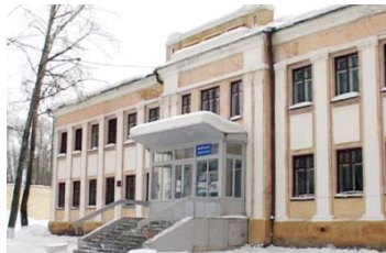
Избирательный участок № 2378

Дворец культуры «Огнеупорщик», г.Первоуральск, улица Ильича, 13. Телефон 27-83-87 .