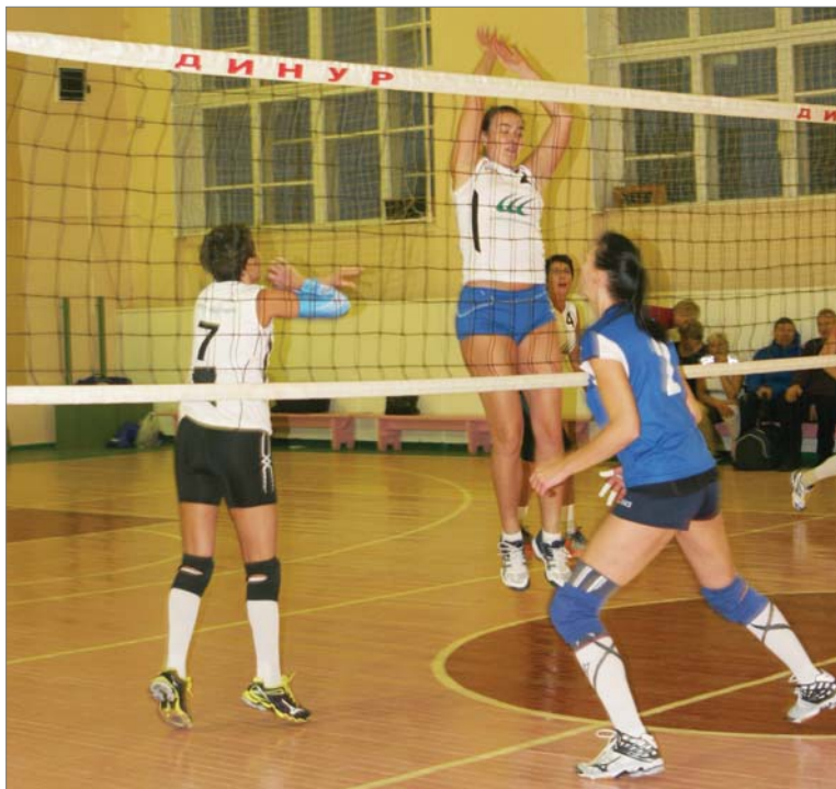
У сетки – волейболистки Омска и Челябинска.

- Многие команды ежегодно участвуют в первенстве России. Челябинцы стали его «бронзовыми» призёрами. Омички - «серебряные» призёры первенства страны