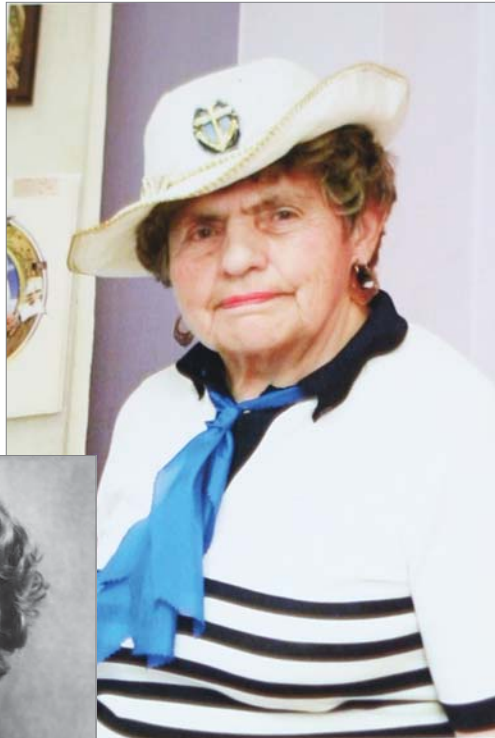
«Живу нескудно – читаю, придумываю, мастерю».