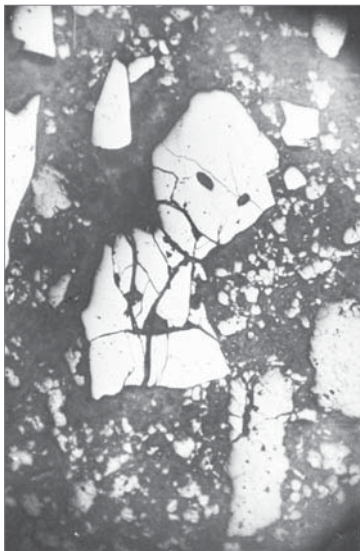
«Космический пришелец» в периклазовой торкрет-массе.

В заводской лаборатории материаловедения уже 15 лет осуществляется комплексное исследование разных видов сырья неорганического состава, огнеупорных материалов и изделий практически всех российских и зарубежных производителей. Главный рабочий инструмент материаловедов — оптический микроскоп, позволяющий изучить минеральный состав и структуру огнеупора при увеличении до 1000 раз. В этом году в нашем распоряжении появились два современных японских микроскопа. Оптический метод даёт возможность