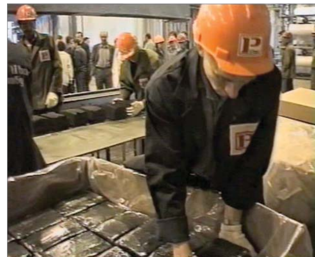
Первая продукция нового производства.

такой коллектив, который напряжённо работает на результат.