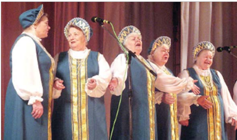
«Сударушку» любят зрители.

Двадцать лет назад в культурном пространстве Динаса стало одним вокальным коллективом больше, 1 октября на сцену ДК «Огнеупорщик» вышел хор заводских ветеранов. Правда, ещё без названия. Через год, в 97-м коллектив отмечал свой первый день рождения уже наречённый «Сударушкой».