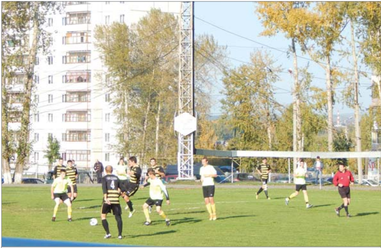
«Динур» завершил домашнюю серию игр чемпионата.