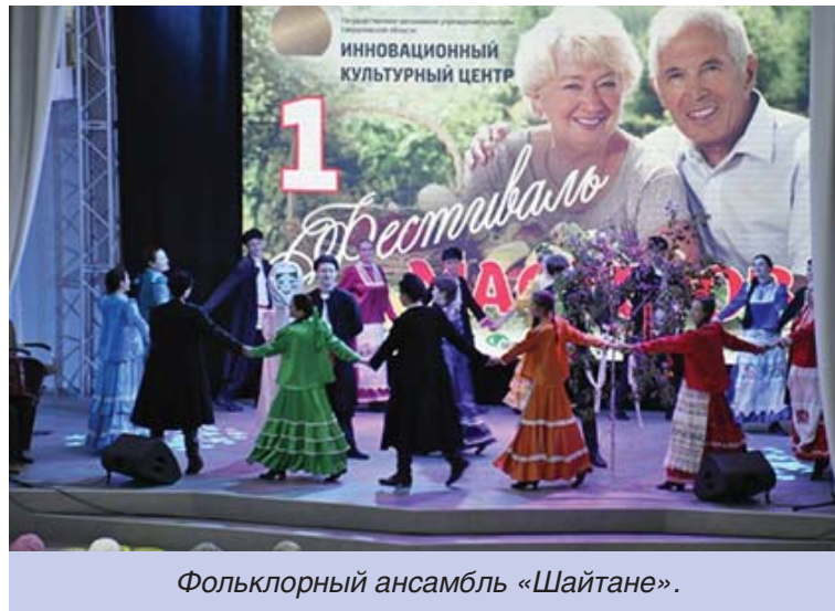
Фольклорный ансамбль «Шайтане».

– Я представляла изделия, связанные крючком – игрушки Дед Мороз, овечка, корзинка для клубков в виде поросёнка. Было мно-