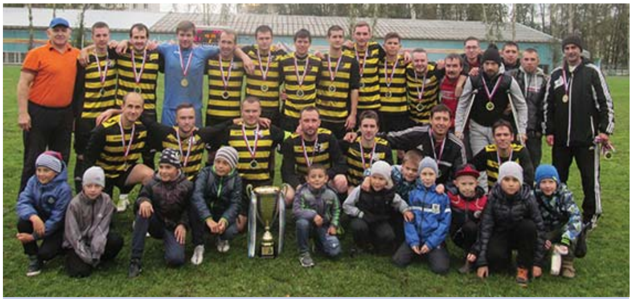
Из юных надежд часто вырастают мастера футбола.

- Была пара особенно сложных игр. В начале чемпионата выезжали в Реж. Вели в счёте 1:0, не давая соперникам центр поля перейти, и вдруг за восемь минут до конца матча пропускаем случайный гол. Отыгрались на последней минуте. Или приехали в Арти в августе. Жара, травы на поле просто нет, вся выгорела. Мяч на бетонном покрытии скачет, ничего сделать не можем. Минут за десять до конца встречи еле-еле забили.