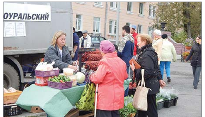
Вкусная продукция «Первоуральского» пользовалась спросом.

Товары от сельхозпроизводителей были рассчитаны не только на садоводов. Последние заинтересован-