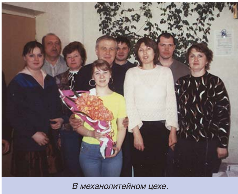
В механолитейном цехе.