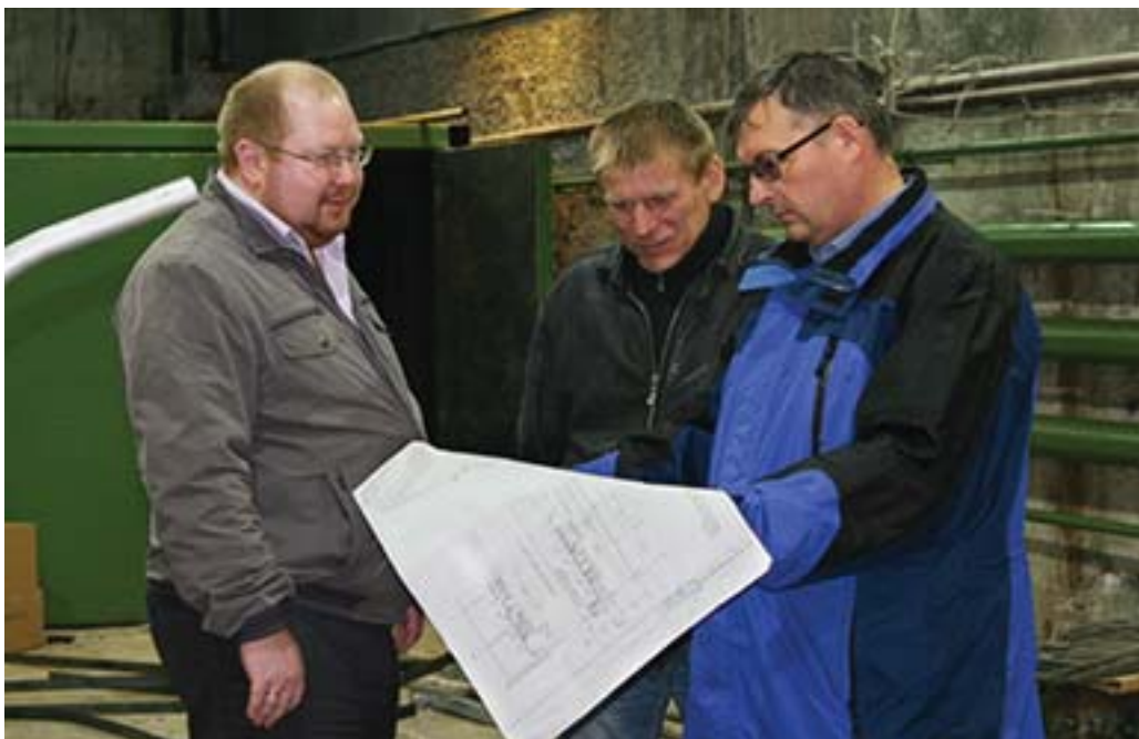
Специалисты ПКО и строители вместе ищут ответы на возникающие вопросы.

Каждый возводимый на предприятии объект - своего рода детище специалистов проектно-конструкторского отдела. Они курируют его с самого начала до сдачи.