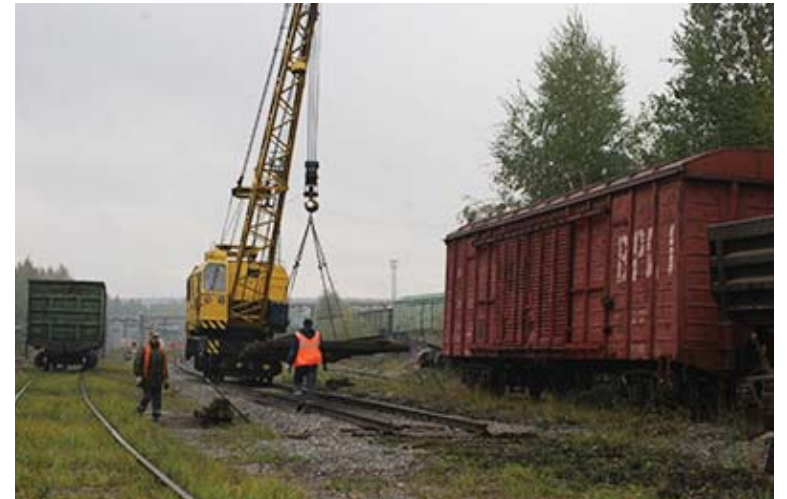
Бригада монтеров меняет звенья железнодорожного пути.

Бригада монтеров пути железнодорожного цеха продолжает укладывать новые звенья на рельсовых транспортных ветках.