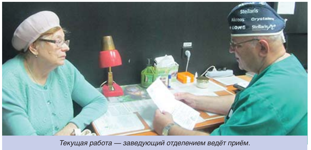
Текущая работа — заведующий отделением ведёт приём.

тальмология ощутимо шагнула вперёд. Когда я начинал работать, оперировали такими инструментами, что не приведи Бог снова их взять в руки. Сейчас о них даже не вспоминаем. Не было никаких искусственных хрусталиков, после операции человек был вынужден носить громоздкие очки с толстыми «плюсовыми» стёклами. Технологии лечения заболева-