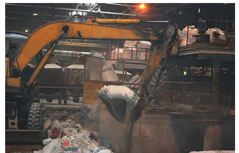
Идёт демонтаж первой печи РКЗ-4.

Ванна теплового агрегата снята, газорезчики из «Вторчермета» разрезают её на металлолом. Старый фундамент ломают представители подрядной организации «Базис». Работают экскаватор и самосвал. Шум, пыль. Но эти неудобства для плавильщиков временные и они их особенно не стесняют. В коллективе ждут новую печь, более современную и производительную. И у оборудования есть свой век. Первой РКЗ-4 пришёл срок уступить место тепловому агрегату нового поколения. Нестандартное оборудование для её «преемницы» будут делать специалисты механолитейного цеха. Опыт в этом плане у них большой. Вторая и третья печи успешно работают.