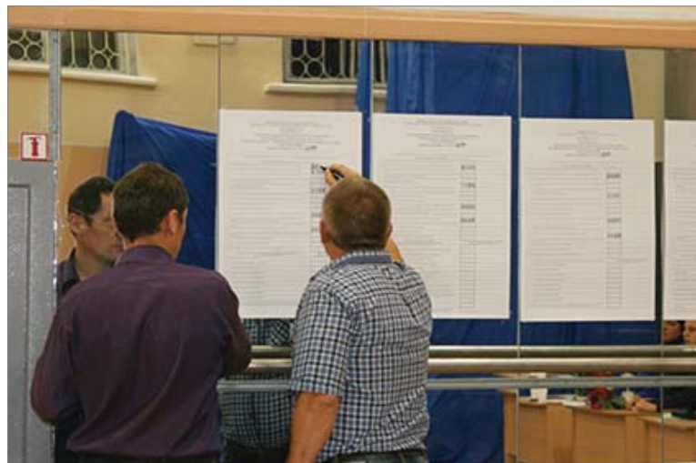
Невидимая избирателю работа: все итоговые цифры надо внести в протоколы, идёт подсчёт бюллетеней.

На свой избирательный участок, что располагался на центральной проходной ОАО «Уралтрубпром», пришли вечером. Основная волна избирателей уже схлынула. Члены избирательной комиссии внимательны и доброжелательны к каждому посетителю. Убедились, что отработанная схема работает как часы. Люди расписываются за полученные бюллетени и опускают их в прозрачную урну. Судя по уровню заполненности пластиковых кубов, жители близлежащих улиц тоже не остались в стороне.