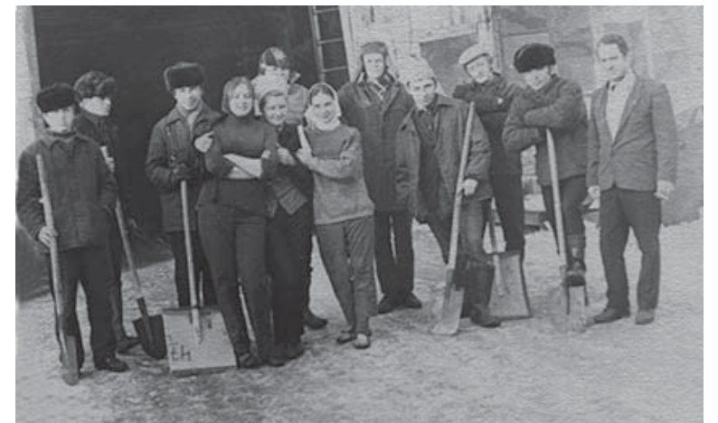
Комсомольский субботник, 1972 год.