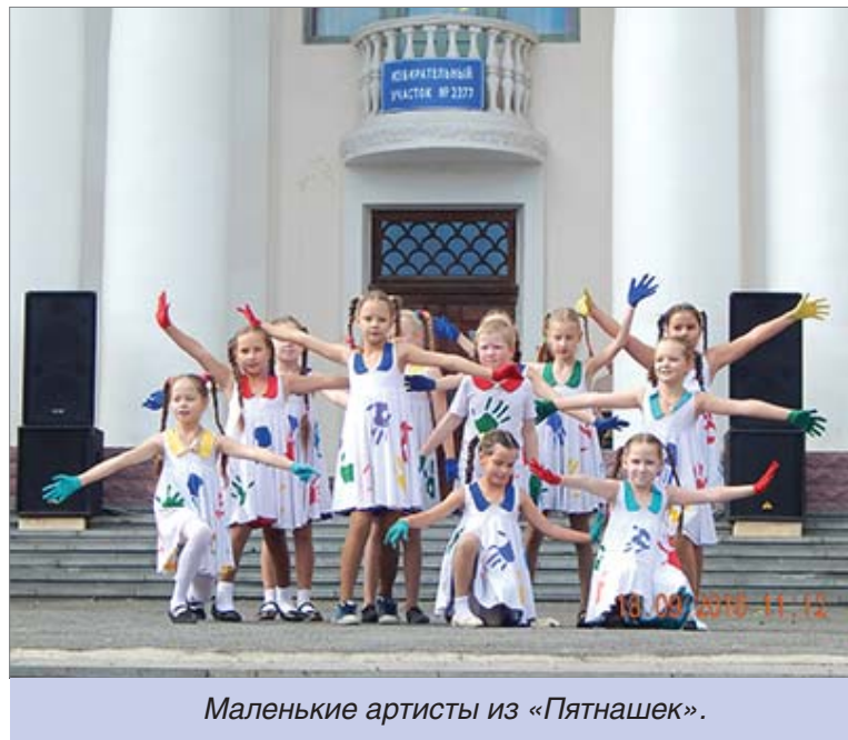
Маленькие артисты из «Пятнашек».

За тем, как быстро и, кажется, так просто из зелёных, розовых, жёлтых воздушных шаров получаются бабочки, собаки, мечи, пришедшие взглянуть на «Урожай талан-