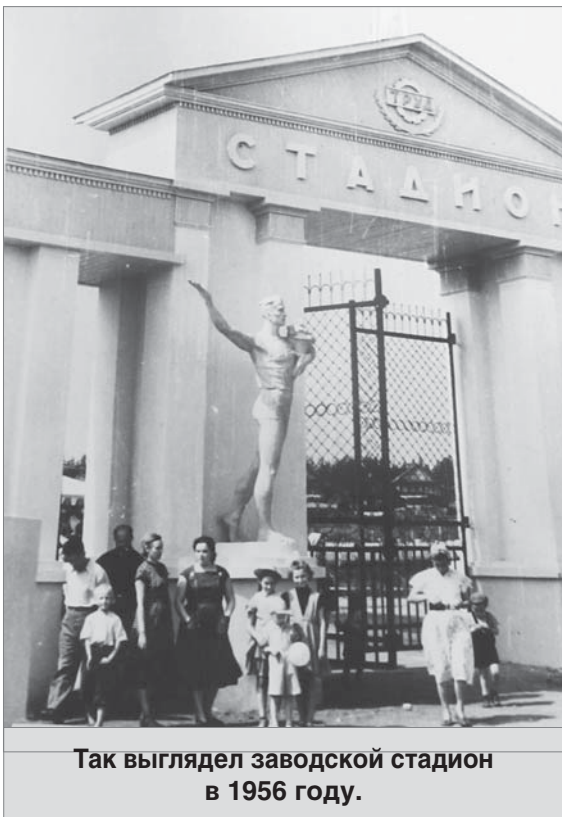
Так выглядел заводской стадион в 1956 году.

Заводскому физкультурному движению в этом году исполнилось семьдесят лет. У его истоков стояли неравнодушные люди.