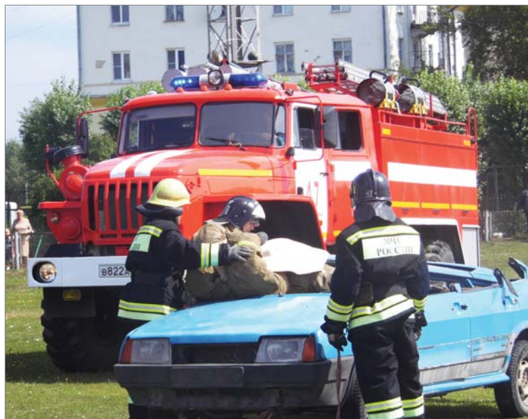
Счёт – на секунды. Специалисты МЧС спасают пострадавшего в аварии водителя.