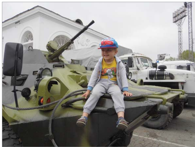
Я тоже буду защищать людей!