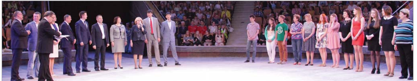
Депутаты ЗакСо награждают победителей творческого конкурса «Камертон».

Ежегодный, уже двенадцатый областной творческий конкурс «Камертон» под патронажем Законодательного Собрания Свердловской области состоялся под девизом «Патриот – это звучит гордо!»