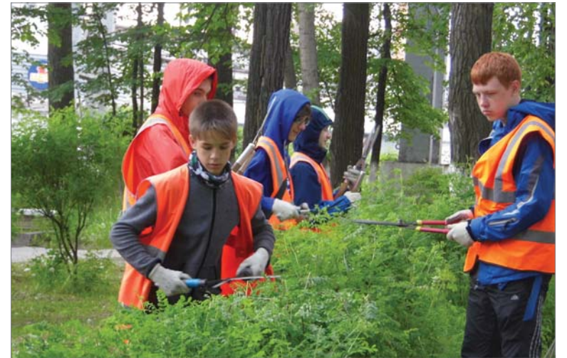
Школьники подрезают кусты на заводской аллее.

Весь июнь на заводе будут работать тридцать старшеклассников пятнадцатой школы.