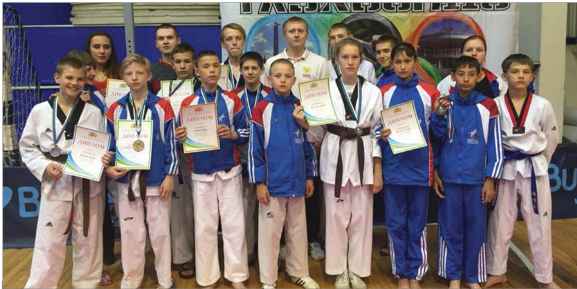
Участники первенства области по тхэквондо (сборная города).