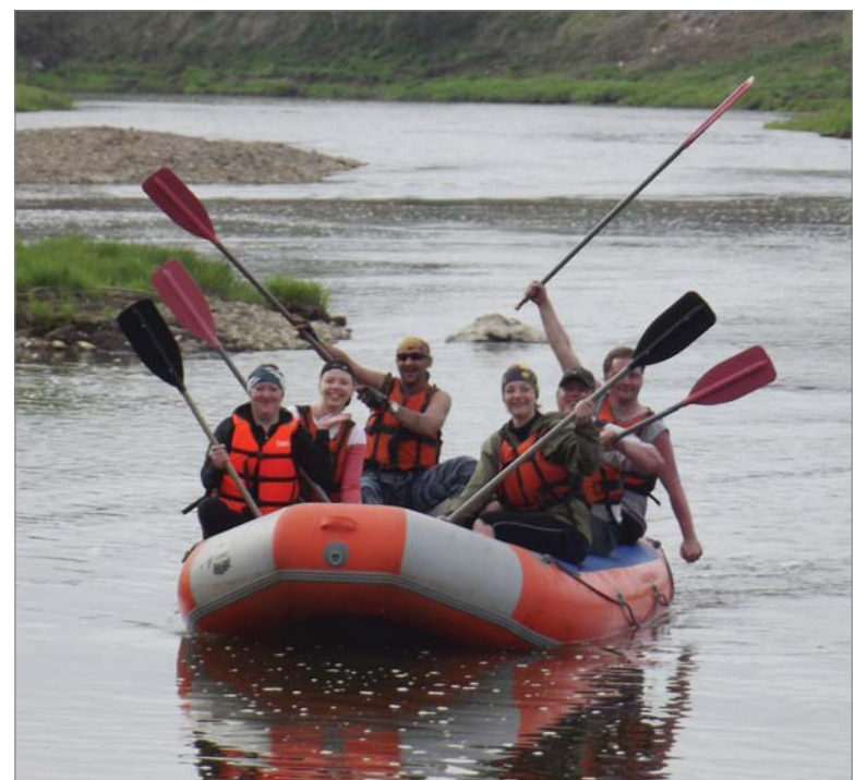
Динуровцы во время предстартовой тренировки.