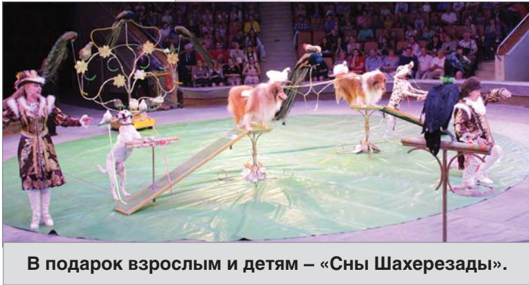
В подарок взрослым и детям – «Сны Шахерезады».

В картинах, спектаклях, фильмах, книгах, стихах и песнях уральцы выразили свое представление о патриотизме. В конкурсе приняли участие около 400 детей и взрослых из 53 муниципальных образований Свердловской области. «Камертон» проходил в течение полугодия, и в минувшую пятницу были награждены 48 человек по восьми номинациям, отдельно среди профессионалов и любителей: литературные произведения; музыкальные; произведения изобразительного искусства; спектакли; кино- и видеofilмы; радио- и телепередачи, публикации в периодической печати; культурные проекты (выставки, экспозиции, фестивали, кон-