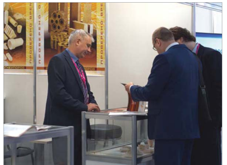
ИННОПРОМ — 2015. У заводского стенда.

Все четыре дня выставки будут рабочими, чтобы деловые люди смогли оптимально использовать свой график для переговоров. За это время планируется провести около 200 мероприятий, презентаций, встреч и пресс-конференций на самые актуальные темы. Основные разделы выставки: индустриальная автоматизация; технологии для энергетики; промышленный интернет; логистика; финансирование производств; машиностроение; производство компонентов; технологии и оборудование для обработки материалов; технологии для городов.