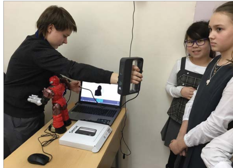
Мастер-класс по 3D - моделированию.