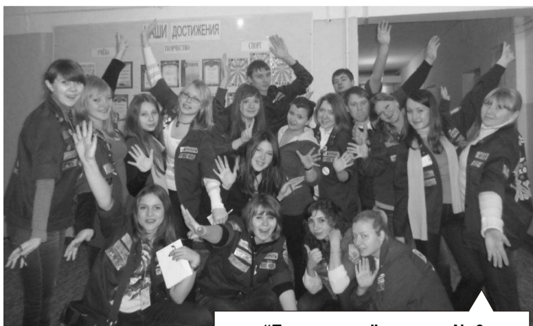
«Белая рысь» в школе № 6

Молодежный отряд «Белая рысь» десантировался в нашем городе на прошлой неделе.