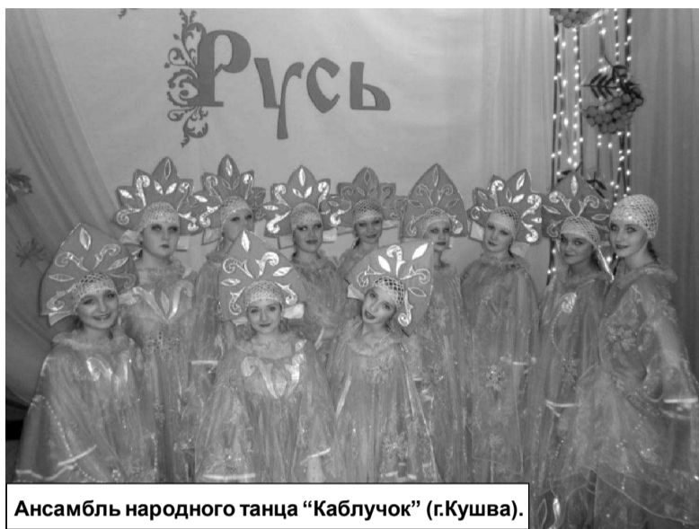
Ансамбль народного танца «Каблучок» (г.Кушва).