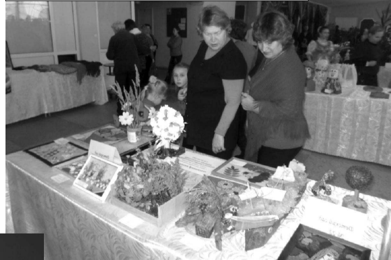
Посетители выставки декоративно-прикладного искусства были приятно удивлены увиденным.