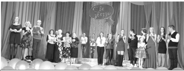
Участники конкурса «Две звезды».