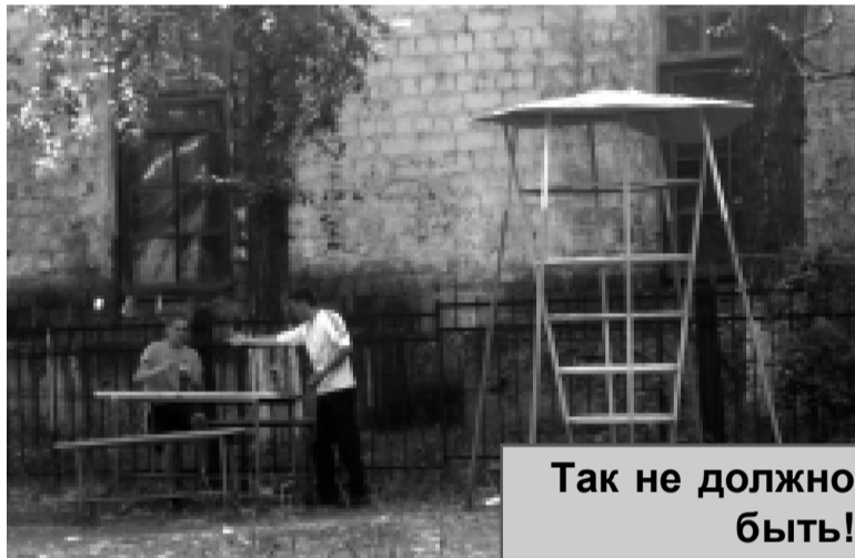
Так не должно быть!

ОПРОС В ТЕМУ: Как относятся красноуральцы к распитию алкогольных напитков на детских площадках (в общественных местах)?