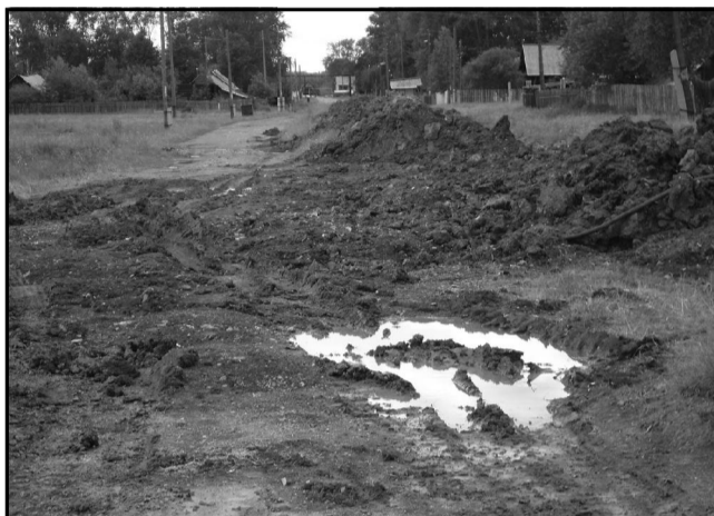
Пос. Октябрьский. Раскопки произведены, вторую неделю ждем экскаватор и сварочный аппарат