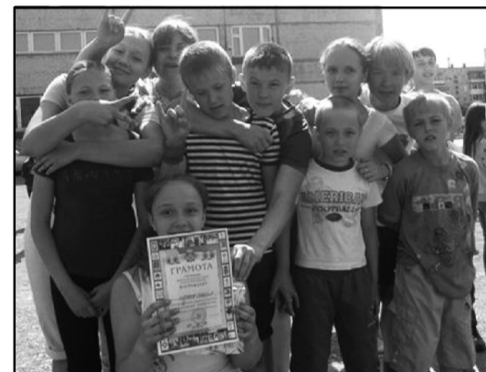
Команда школы №8 - серебряный призер спортивного праздника Большой хоровод

Все победители и призеры награждены грамотами МКУ «УФК, -СимП» и сладкими призами.