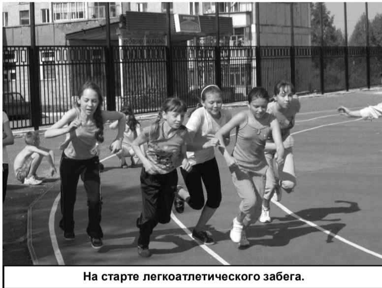
На старте легкоатлетического забега.

Все победители и призеры спортивного праздника были награждены грамотами МКУ «УФК-СМП» и сладкими призами.