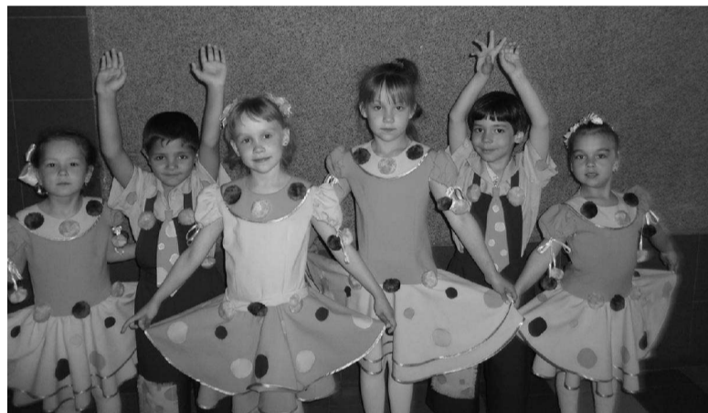
«Подсолнухи» (ДК «Металлург») радовали других детей.

дорные танцы не оставили никого равнодушным. А какие хороводы юные артисты водили с малышами! Всем детям вручили подарки и сладости в честь их праздника.