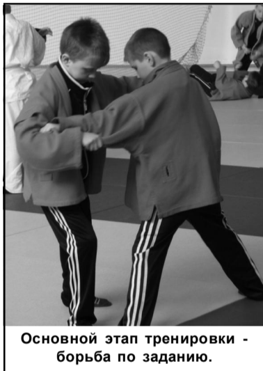
Основной этап тренировки - борьба по заданию.