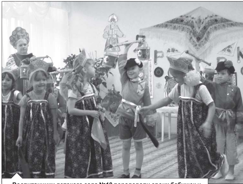
Воспитанники детского сада №18 порадовали своих бабушек и дедушек песнями и плясками.

Как не порадовать этих славных тружеников! Доброй традицией стало про-