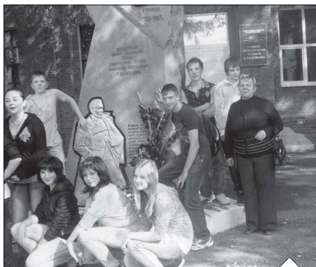
Во время экскурсии на родине легендарного разведчика Николая Кузнецова.

ки. Все исследовательские работы писались учащимися от руки, на стендах мы увидели несколько работ и дневников наблюдений Николая Кузнецова. Экскурсовод подробно рассказала о годах учебы нашего земляка, обратила внимание на тот факт, что он хорошо учился, а немецкий язык изучал самостоятельно и говорил на нем отлично, имел прекрасную память. Мы узнали, что, по некоторым данным, будущий разведчик закончил УПИ, но подтверждающих документов нет. Рассказ о деятельности разведчика в тылу врага и партизанском отряде вызвал огромный интерес у наших детей, они задавали вопросы по ходу беседы, рассматривали макеты оружия и фотографии, читали донесения разведчика и документы, представленные на стендах. Учащиеся заинтересовались вопросом о перезахоронении тела разведчика, экскурсовод показала фотографию могилы героя и