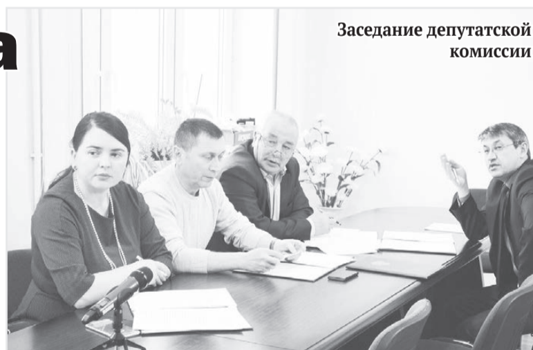
Заседание депутатской комиссии

Непосредственно на предприятиях, планирующих массовые высвобождения, оказываются консультации о наличии профильных вакантных рабочих мест, о возможности повышения квалификации и переобучения.