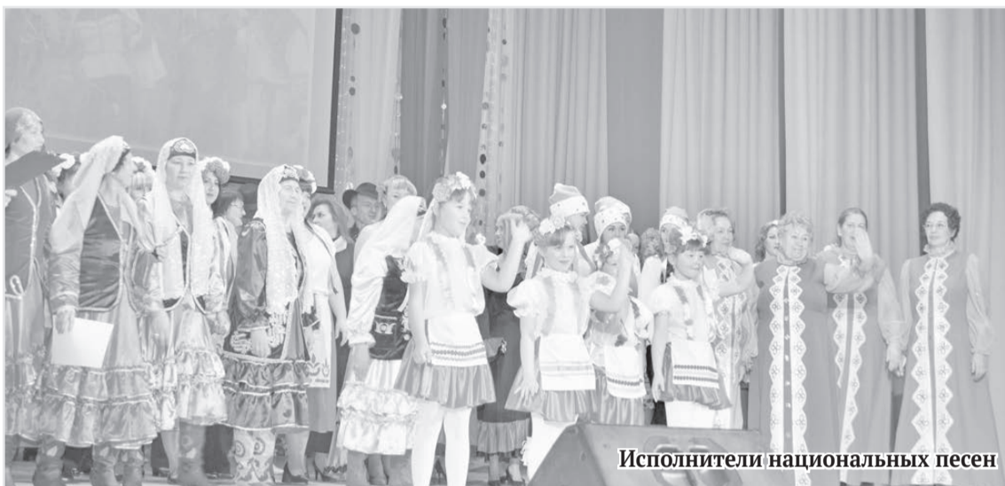
Исполнители национальных песен