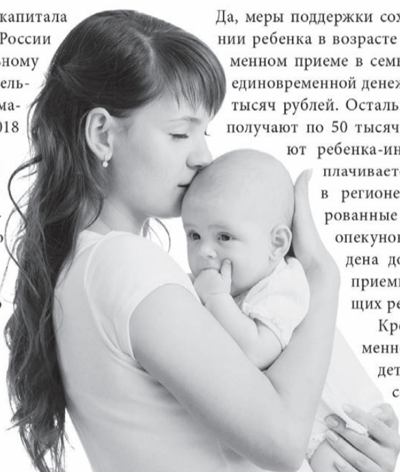
По материалам департамента информполитики губернатора Свердловской области

Сегодня при рождении 3-го или последующего ребёнка уральские семьи имеют право на получение регионального маткапитала. С учетом индексации, в 2015 году размер данной выплаты составляет более 116 тысяч рублей, а в случае рождения одновременно 3-х и более детей семье выплачивается единовременная сумма – свыше 175 тысяч рублей.