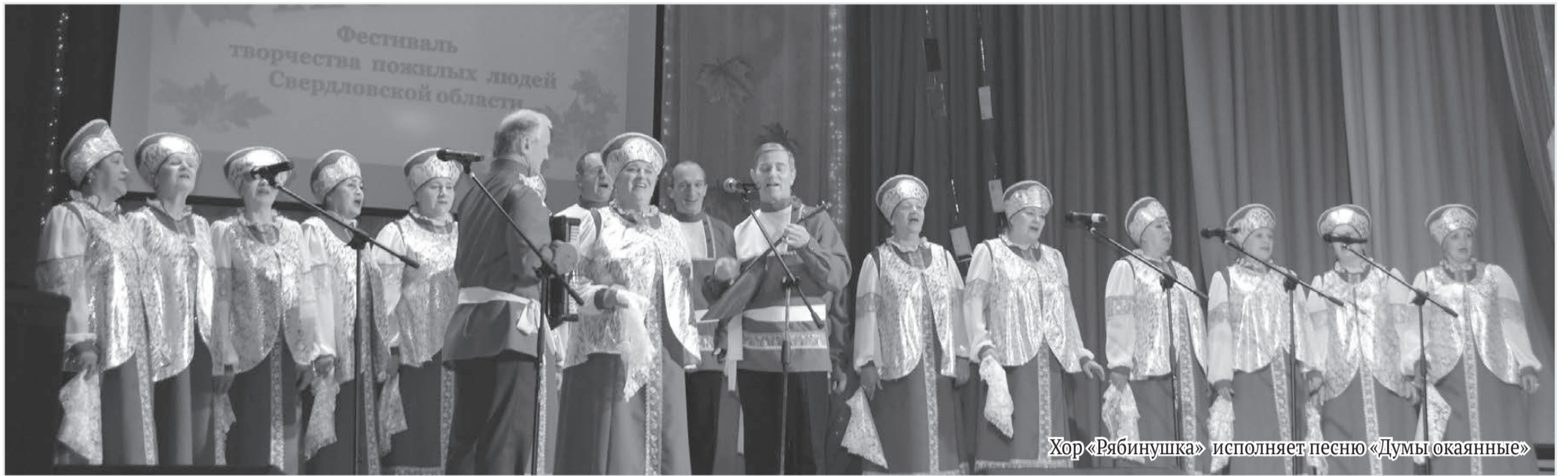
Хор «Рябинушка» исполняет песню «Думы окаянные»