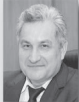
Юрий Биктуганов, министр образования Свердловской области:

«Региональные власти и уральцы высоко ценят политику социально ответственного бизнеса, когда компании и предприятия не только создают рабочие места, обеспечивают выпуск современной продукции и отчисления в бюджеты всех уровней, но и активно участвуют в социальных проектах, программах государственно-частного партнерства, поддерживают образовательные, культурные и спортивные учреждения, на территории которых они расположены».