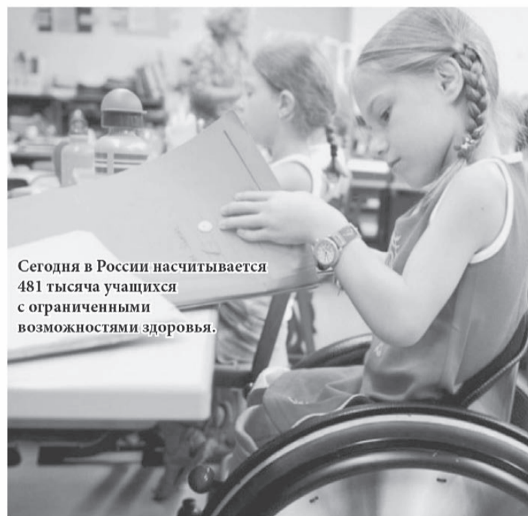
Сегодня в России насчитывается 481 тысяча учащихся с ограниченными возможностями здоровья.