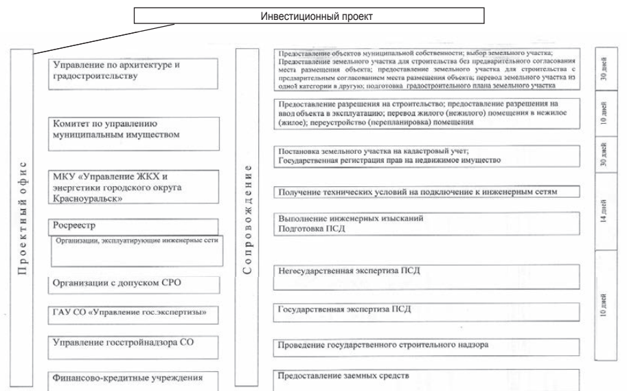
Схема сопровождения инвестиционных проектов в городском округе Красноуральск Свердловской области