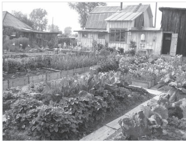
Огород семьи Дегенгардт - образец для подражания

Ксения ПОСТНИКОВА, ведущий специалист отдела по работе с населением Управления ЖКХ и энергетики