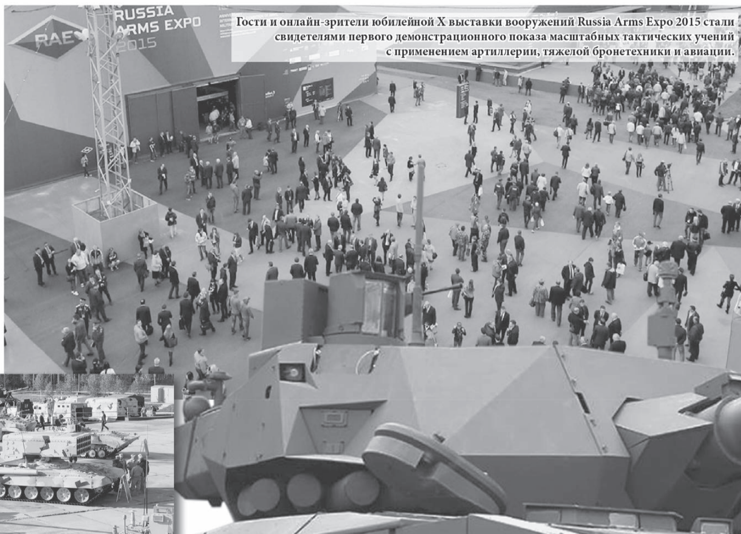
Гости и онлайн-зрители юбилейной X выставки вооружений Russia Arms Expo 2015 стали свидетелями первого демонстрационного показа масштабных тактических учений с применением артиллерии, тяжелой бронетехники и авиации.

Выставка RAE – важная площадка, продвигающая продукцию отечественного ОПК на внутренний и внешний рынки. Это генератор очень серьезных контрактов, которые помогают России занимать высочайшие позиции на рынке вооружений. «Россия сегодня занимает 2 место в мире по объемам экспорта вооружений, и демонстрация нашей мощи на подобных выставках очень важна», – сказал Дмитрий Медведев. Губернатор Евгений Куйвашев подчеркнул, что RAE позволяет заявить о Свердловской области на международном уровне и привлечь инвестиции в регион.