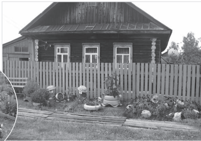
Никто не пройдёт равнодушно мимо дома Ворониных