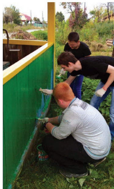
Итогом работы трудового лагеря в рамках программы «Родники» стала фотовыставка «Живи, родник!»

За период работы лагеря ребята привели в порядок четыре колодца, закрепленных за школой №8: скосили траву, убрали мусор, покрасили деревянную отделку и ограждения. После уборки колодцы, расположенные на улицах Лермонтова, Яна Нуммура, Западной, Серова, радуют глаз прохожих. Во время работы ребята общались с местными жителями, которые выразили пожелание почистить и прокачать колодцы, сменить ведро.