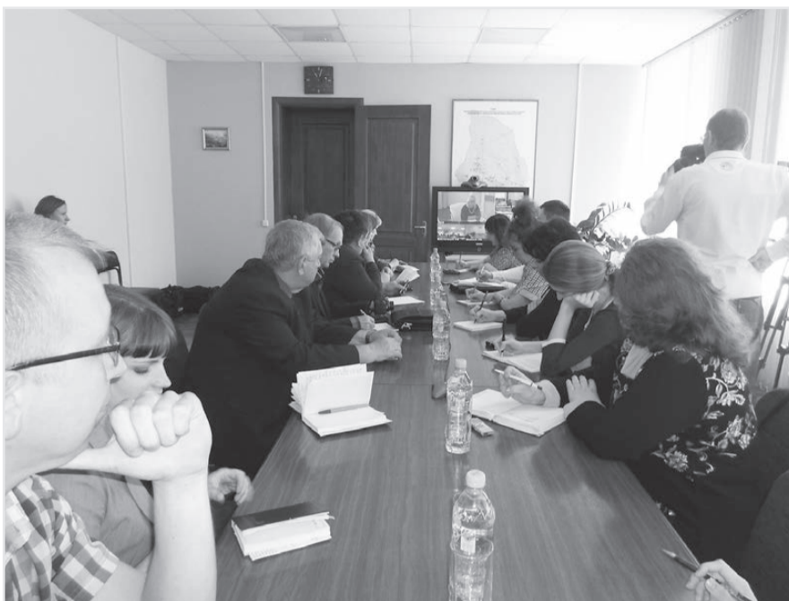
Представители Северного управленческого округа на видеоконференции