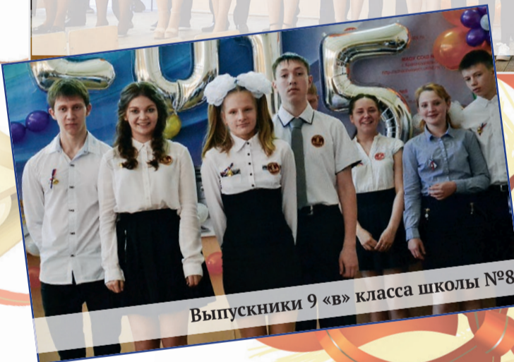
Выпускники 9 «в» класса школы №8

одиннадцати лет вкладывали в них не только знания, но и частичку своего сердца. Расставание с выпускниками для них всегда волнительно, но они уверены, что воспитанники преодолют и этот сложный жизненный этап, сдадут от-