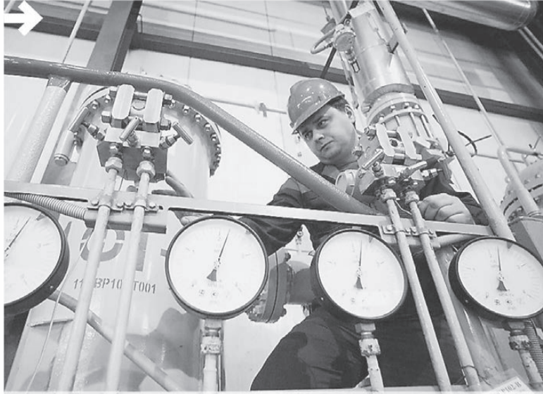
В сфере ЖКХ Свердловской области сейчас реализуются 75 инвестпроектов

«Наша стратегическая установка на мобилизацию экономического и общественного потенциала региона даёт свои результаты»