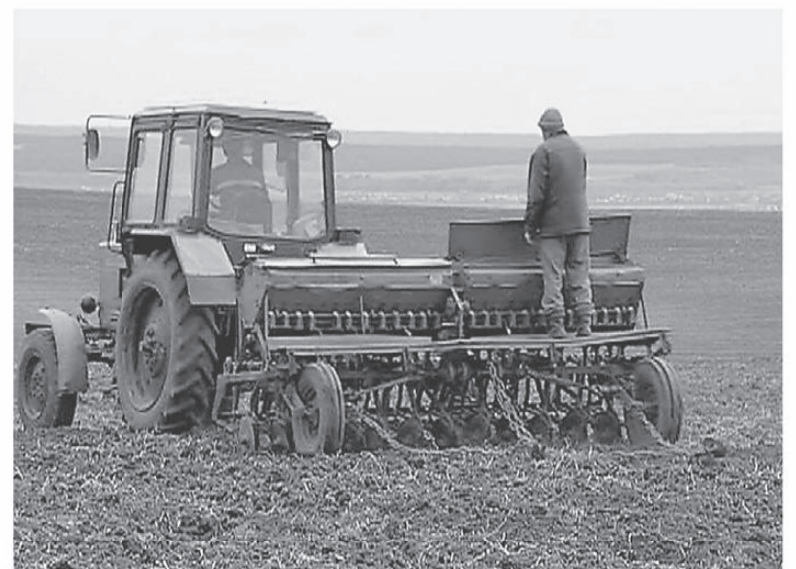
20 тысяч тонн минеральных удобрений внесут на поля в этом году

По последним данным министерства сельского хозяйства РФ, в южных районах страны посевная началась на 2 недели раньше. Мы не исключаем, что благодаря хорошей погоде и мы сможем выйти в поля раньше. А пока в рабочем порядке готовимся к кампании».