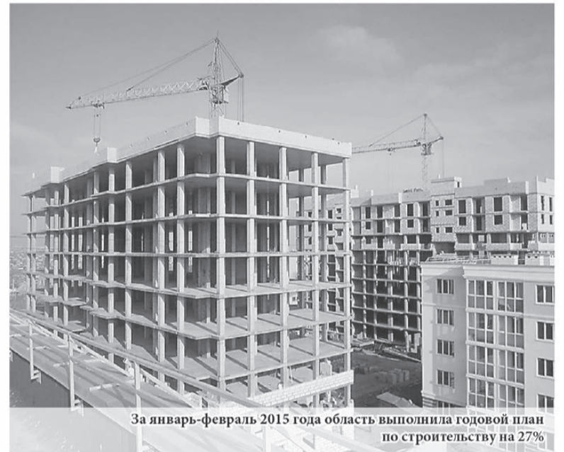
За январь-февраль 2015 года область выполнила годовой план по строительству на 27%

годового плана. Всего к концу года мы планируем построить 2,1 миллиона квадратных метров жилья. Но важно понимать, что сейчас сдаётся то, что начало возводиться в 2013 году – начале 2014 года. Поэтому сегодня мы должны делать задел на будущие периоды. Важно, чтобы застройщики не только работали над завершением имеющих объектов, но и начинали новые проекты, которые будут сдаваться в 2016-2017 годах».