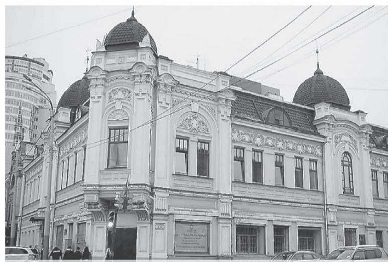
В Екатеринбурге это здание построено купцом Первушиным в начале XX века. В годы Великой Отечественной войны здесь работал прославленный радиодиктор Юрий Левитан. На здании установлена мемориальная доска.

залом и плавательным бассейном. На строительство ФОКа из регионального бюджета в 2014 году было выделено 50 миллионов рублей, в 2015 году – 67,4 миллиона рублей. В настоящее время решается вопрос о привлечении средств из федерального бюджета.