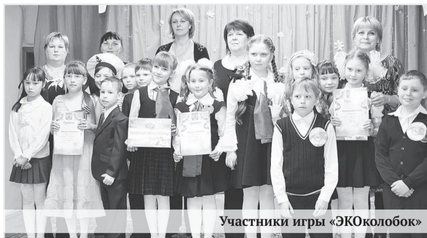
Участники игры «ЭКОколобок»

19 марта в ДЮЦ «Ровесник» состоялось театральное представление в рамках городской интеллектуальной игры «ЭКОколобок» для