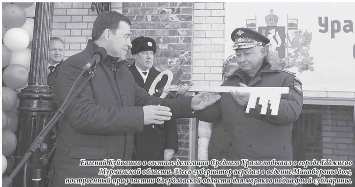
Евгений Куйвашев в составе делегации Среднего Урала побывал в городе Гаджиево Мурманской области. Здесь губернатор передал в ведение Минобороны дом, построенный при участии Свердловской области для моряков подшефной субмарины.