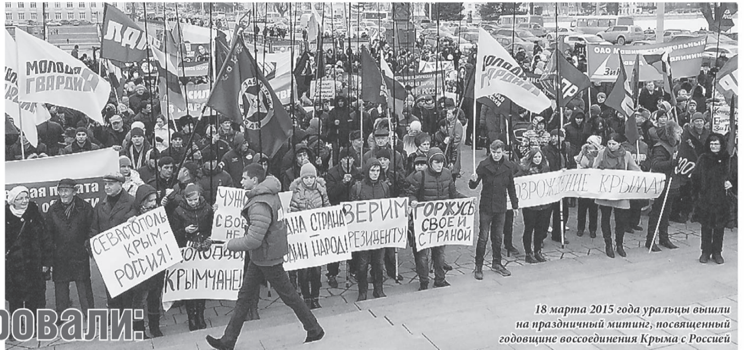
18 марта 2015 года уральцы вышли на праздничный митинг, посвященный годовщине воссоединения Крыма с Россией

Свердловская область за этот год активно шла к сотрудничеству с Республикой Крым. Как это было?