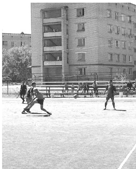
Игровой момент первенства.