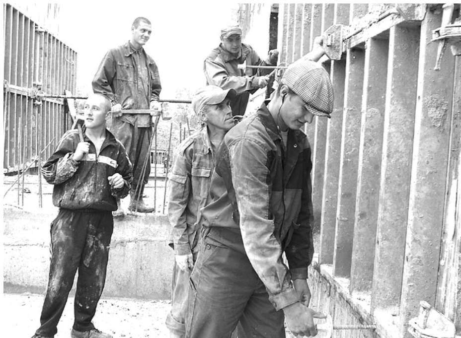
Работники ООО «УралЭнерго-инжиниринг» ведут монтаж опалубки стен.