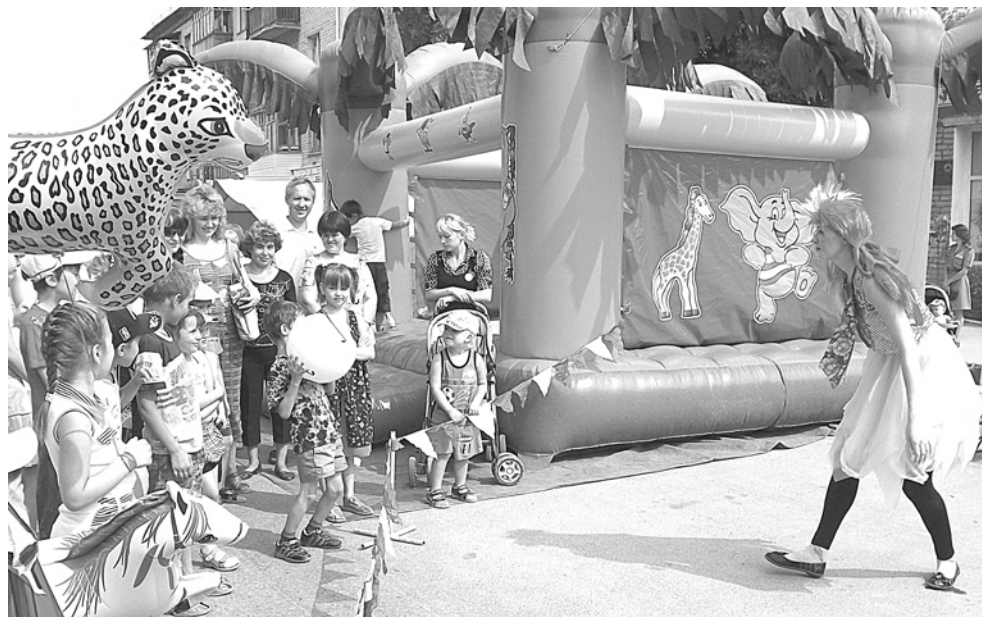
Дети были в восторге от игр с веселым клоуном.