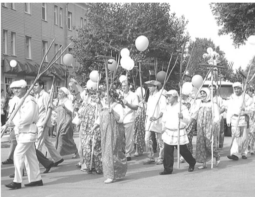
В карнавальном шествии – СПК «Колхоз имени Свердлова».