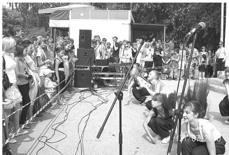
На молодежной площадке было многолюдно.