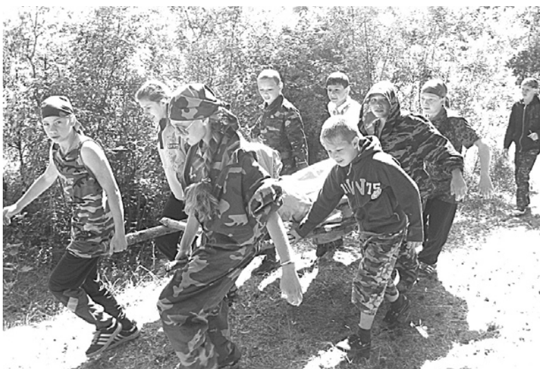
Курсанты из лагеря «Спецназ-юниор» спасают «раненого» товарища.